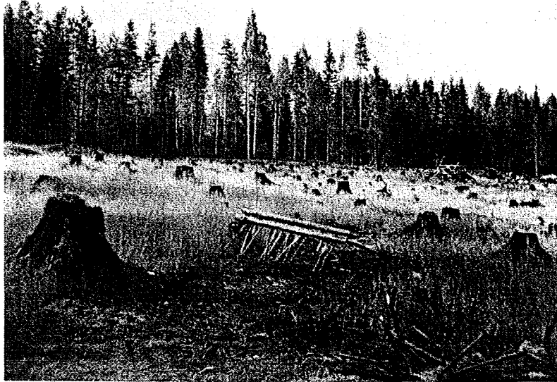
Rågsvedja, Tammerfors 1947.