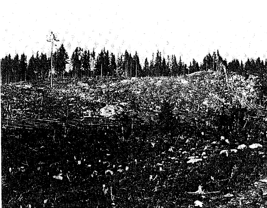
Nysått svedjeland, Värmland 1912

När sådden var klar hägnades svedjan in med den kvarliggande sotveden. Avkastningen på den svedjade marken var i allmänhet högre än på åkern och skördarna var troligen ganska stabila och varierade inte lika kraftigt som på åkern (Kardell 1980). När svedjan sedan skördats användes den vanligtvis som slättermark eller som betesmark för kreaturen. Om svedjan var en engångssvedja kunde den successivt genom jordbearbetning övergå till permanent åker eller äng. Det var den naturliga vägen för att bilda dessa typer av marker. På de ängar som användes för att producera foder till kreaturen kunde man bränna ibland för att tillfälligt förhindra markens degeneration (Kardell 1980). Detta gjordes även på de marker som nyttjades för bete.