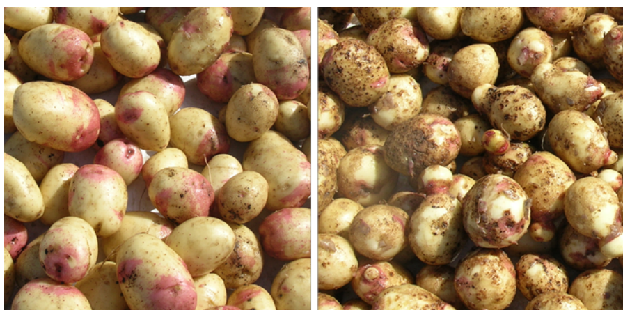
Figur 1. Till vänster ses ett skördeprov från den bevattnade potatisen. Till höger visas den obevattnade potatisen. Det är tydligt fler missformade knölar med kraftiga skorvangrepp i obevattnad behandling.

Det Nordamerikanska företaget Floratine Biosciences har i tidigare studier observerat positiva effekter på fosforupptag i olika växter vid tillförsel av deras produkt Carbon Boost. Speciellt effektivt har preparatet varit då plantorna lidit av någon form av stress. I den här studien testades produkten för första gången i svensk potatisproduktion.