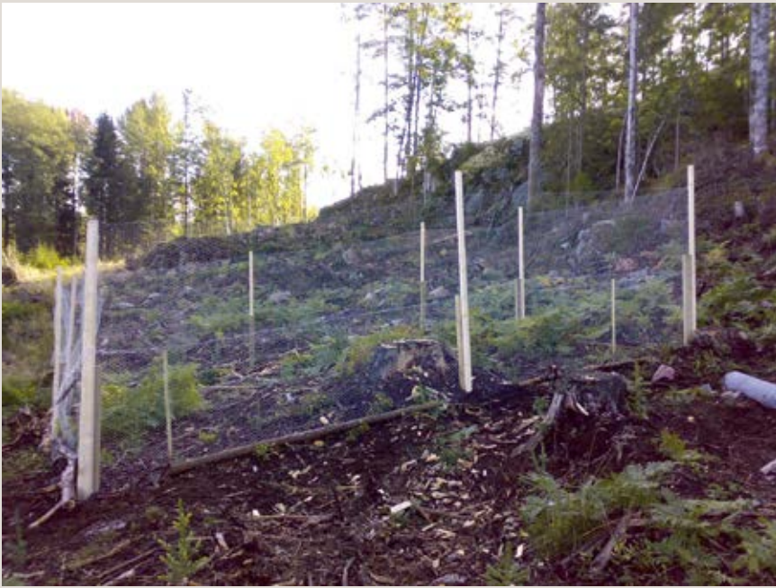
Figur 2. Nyuppsatt referenshågn i Misterhultsområdet (norr om Oskarshamn, Kalmar län) inom temaprogrammet Vilt och Skog. För att underlätta vid uppsättning är stolparna sammansatta av en kort och grov förankringstolpe och en påmonterad bärstolpe.

■ Hjortdjuren (älg, rådjur, kron- och dovhjort) påverkar vegetationen och dess utveckling genom bete och andra aktiviteter. I en plant- eller ungskog finns vanligen ett antal olika trädslag representerade och dessa konkurrerar med varandra om att dominera ytan. Efter-som vissa lövträd och tall betas hårdare än t.ex. gran så försvagas deras konkurrensförmåga. Denna påverkan kan vara så stark att endast de mest vilttåliga träden klarar sig kvar och bildar den framtida skogen. Detta innebär ofta att målsättningar om önskvärd trädslags-sammansättning i våra skogar inte kan uppnås.