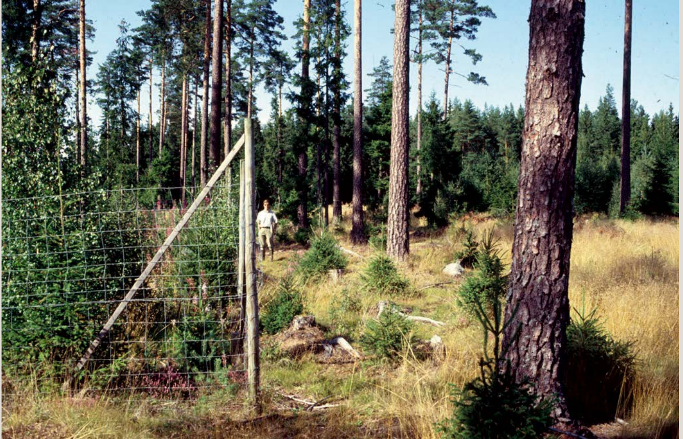
Figur 1. Efter några år kan vegetationen se väldigt olika ut innanför och utanför ett referenshägn.

Jonas Bergquist ▪ Jean-Michel Roberge ▪ Lars Edenius ▪ Göran Ericsson