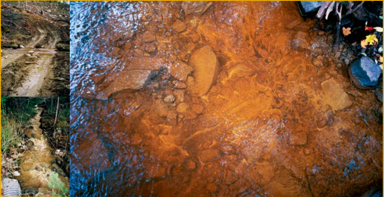
Figur 2. Körskada i samband med slutavverkning kan orsaka erosion, grumling och igenslamning av botten om inte rätt hänsyn tas.

■ Vatten är livsnödvändigt. För att även kommande generationer ska kunna utnyttja denna gemensamma resurs är det av stor vikt att den brukas på ett hållbart sätt. EU:s ramdirektiv för vatten (vattendirektivet, 2000/60/EG) trädde i kraft år 2000. Vattendirektivet innebär en helhetssyn på vatten där medlems-