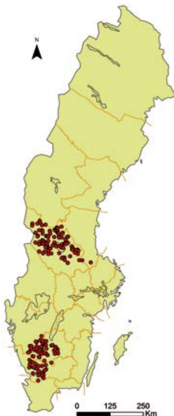
Figur 3. Lokalisering av källvattendrag som ingick i studien. © Lantmäteriet, i2012/901.

NPK+ och Blå målklassning har utvärderats med hjälp av data från elfisken i två tidigare studier. Resultaten visade att vattendrag i Blekinge som indelats i Blå målklasser med högre hänsynsnivå vid skogsbruk innehöll fler artarter (Ingemarsson 2012). Liknande samband hittades vid en inventering av 55 vattendrag i Västerbotten. Där fanns ett positivt samband mellan antalet artarter och vattendrag som hade en högre NPK+-totalsumma (Nordin 2012). Detta pekar på att vattendrag med bra förutsättningar att hysa en rik biologisk mångfald kan identifieras med verk-