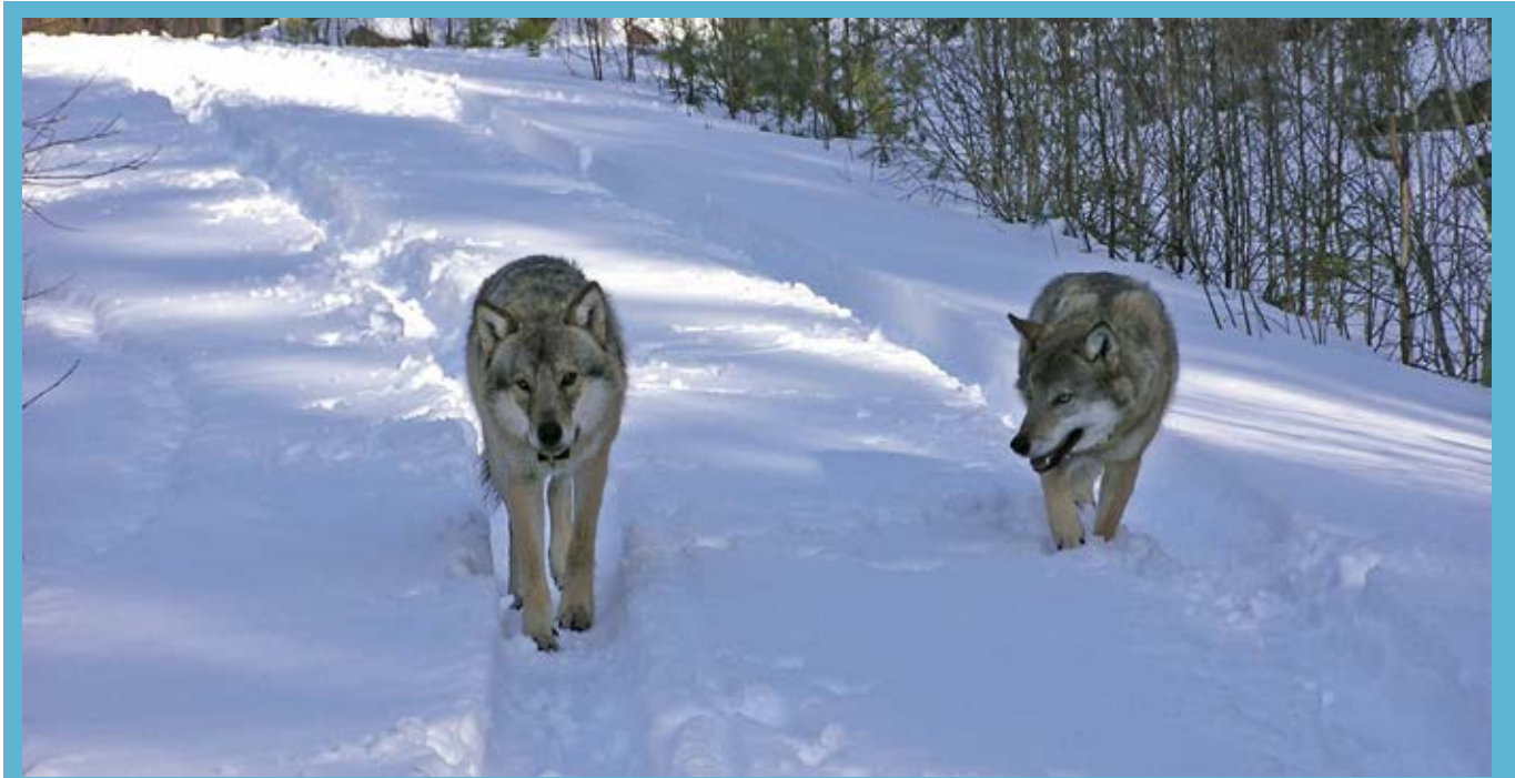
Alfapar vid Amungen.

■ Hur stora hemområden olika arter utnyttjar för sina behov kan variera från några få kvadratmeter för små arter, till många tusen kvadratkilometer för större djur. Även inom arter förekommer en betydande variation i hur stora områden olika individer använder. Denna variation i områdesutnyttjande är kopplad både till ekologiska faktorer såsom livsmiljöns beskaffenhet och till sociala faktorer. Exempel på faktorer i miljön kan vara bördighet och typ av växtlighet. Exempel på sociala faktorer kan