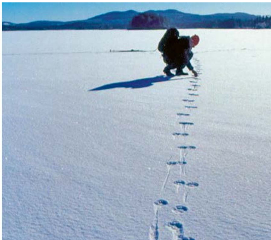
Vargspårning i Leksandsreviret vid Säxen, februari 2002.

ca hälften av älgindividerna är det. Vargarna väljer framförallt unga och gamla älgar. Jaktframgången styrs troligen också av miljön, där vissa områden är mer fördelaktiga för vargen att lyckas med sina attacker medan andra områden är mer fördelaktiga för bytesdjuret för att undkomma dessa attacker. Skillnader i tillgänglighet av bytesdjur, både beroende på art och miljörelaterad jaktframgång, kan då eventuellt förklara en del av de globala skillnaderna i vargens revirstorlek.