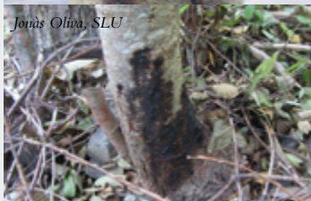
Jonäs Oliva, SLU

P. alni är ett komplex av underarter och hybrider som upptäcktes i Storbritannien under tidigt 1990-tal. Första observationen i Sverige gjordes i mitten av 1990-talet. Arter är jord- och vattenburen. Sprids effektivt mellan kontinenter med handeln av framförallt prydnadsväxter.