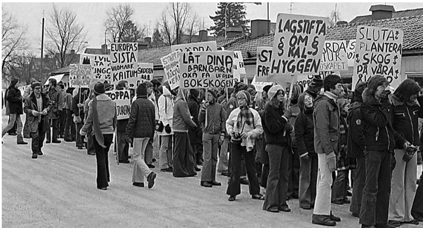
Fältbiologerna demonstrerar mot skogsbruk 1974.