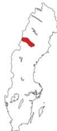
Vilhelmina kommun i Sverige

för att involvera representanter för många olika skogliga intressen och för att föra en diskussion över landskapsnivå, bortom fastighetsgränser och traditionell sektorsplanering. Scenarioanalys kan stärka den lokala handlingskompetensen och hjälpa människor att förbereda sig inför framtiden, att definiera sina behov och identifiera vägar för hur dessa kan tillfredsställas. Lokala intressenters idéer och erfarenheter är viktiga resurser för att skapa nya lösningar. Samtidigt är det viktigt att använda metoder i scenarioarbetet som skapar en meningsfull process för alla deltagare – en process som präglas av förtroende, legitimitet, ansvarskänsla och hänsyn i nära kontakt med beslutsfattare. Det behövs lokala forum för att skapa koordinerat samarbete och kunskapsutbyte mellan olika aktörer. Vilhelmina Modellskog kan vara en sådan arena ■