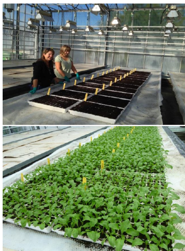
Figur 1. Växthushörsök med sockerbetsfrön pelleterade med olika proteinbaserade blandningar.

I växthushörsöken (Figur 1) uppvisade de unga betplantorna, där fröna pelleteras med proteinbaserade blandningar likartad utveckling som de frön som pelleteras på standardvis. Detta innebär att inga skillnader i groning och uppkomst kunde påvisas. Vid skörd av de unga plantorna resulterade de olika proteinblandningar framför allt i olika rot/skott fördelningar (Figur 2). Vissa skillnader kunde också påvisas i friskvikt