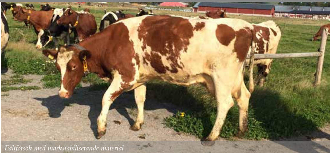
Fältförsök med markstabiliserande material

Upptrampade och leriga ytor på kornas bete kan påverka kotrafik, djurhälsa och mjölkkvalitet. En lösning kan vara att använda tramptåliga vallfröblandningar. En annan lösning kan vara att stabilisera markytan på särskilt hårt belastade ytor, exempelvis vid grindhål. Här rapporteras preliminära resultat från ett forskningssamarbete mellan SLU och RISE.