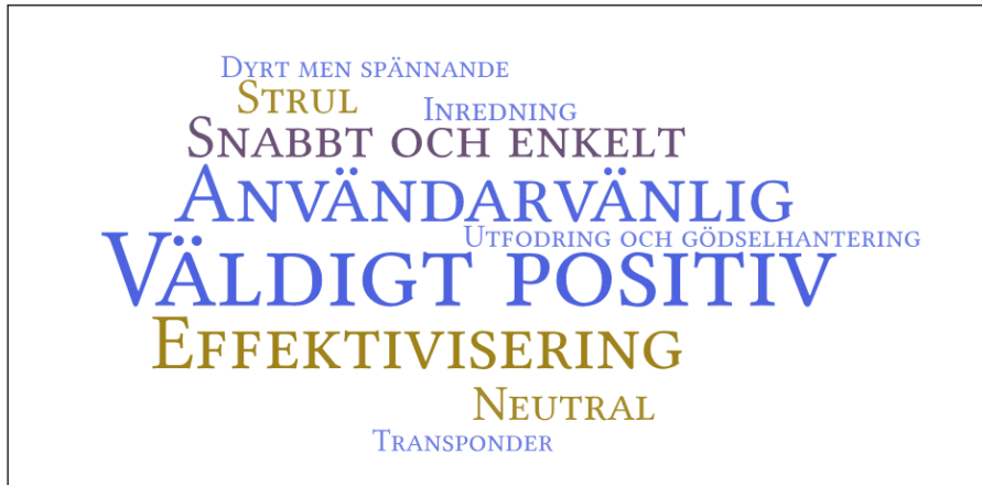
Figur 1. Illustration av de ord som oftast användes i samband med teknik och dess implementering på gårdarna under intervjuerna och i enkäten.

datarelaterad infrastruktur på gårdsnivå samt möjligheter till datautbyte mellan olika parter; lantbrukare, forskare, rådgivare, veterinärer.