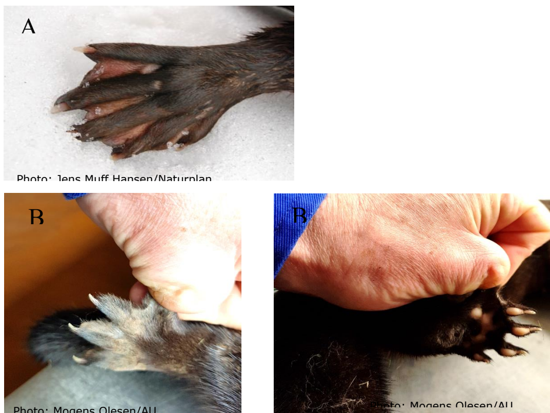
Figur 1. Exempel på baktassar från A. Flodutter och B. Farmad mink.

Mink uppvisar några semi-akvatiska vanor i naturen, och betecknas därför vara ”semi-akvatisk”, men vild mink färdas också långa sträckor på land (Birks & Linn, 1982; Stevens et al. , 1997). De morfologiska likheterna mellan mink och den semi-akvatiska uttern är mindre uppenbara än förväntat. Botton-Divet et al. (2017) konstaterade att: ”I motsats till vår ursprungliga hypotes överensstämmer inte formen på benen signifikant med utterns. Uttern uppvisar ett stort antal varianter av former vilket föreslår att en semi-akvatisk livsstil kan leda till en stor variation av lokomotoriska beteenden” (Botton-Divet et al. , 2017). Dunstone (1993) noterade att minkfötter är nästan utan hud mellan tårna (se även figur 1) och mer typiska för djur som rör sig snabbt på land. Fotens ytarea är relativt liten vilket också tyder på att de är anpassade för rörelser på land (Dunstone, 1993).