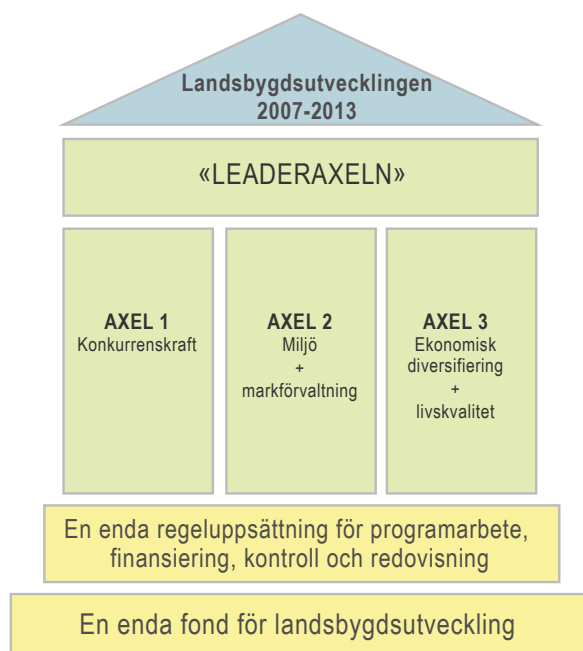
Figur 1. Landsbygdsutvecklingens uppdelning på fyra axlar (Europeiska gemenskaperna, 2006). 2

Landsbygdsprogrammet innehåller även inbyggd (ekonomisk) prioritering av de ekologiska och ekonomiska aspekterna av hållbar utveckling, vilket är en avspeglning av den europeiska jordbrukspolitiken mål och strategier (se Europeiska gemenskaperna 2006).