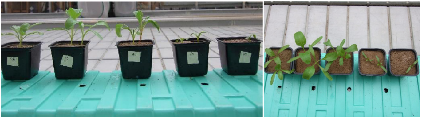
Figur 1. Unga sockerbetsplantor (fyra veckor) odlade utan tillsats av biostimulanter (de två plantorna till höger) och med tillsats av växtbaserade proteiner, s.k. biostimulanter (de tre plantorna till vänster).