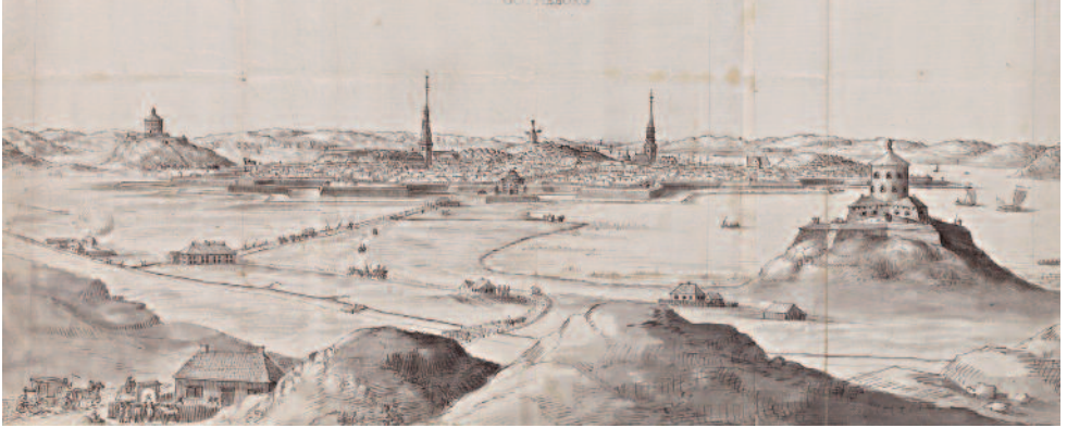
Vägen in mot Göteborg österifrån, med bland annat Kungssporten och skansen Lejonet i förgrunden. Teckning (beskuren) av Johan Litheim 1708 för Suecia antiqua et hodierna.