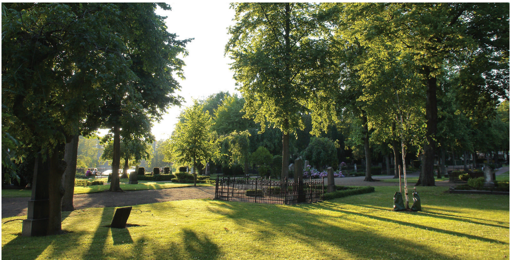
Åtgärder som utgör en väsentlig ändring av kulturmiljön på begravningsplatser kräver ofta tillstånd från myndighet.

Det är alltid du som förvaltare som ska ta fram detta underlag. Beroende på hur omfattande åtgärden är behövs olika mycket underlag, tumregeln är att ju större åtgärder desto mer omfattande underlag behövs. Eventuellt kan du behöva ta hjälp av sakkunniga för att ta fram detta underlag.