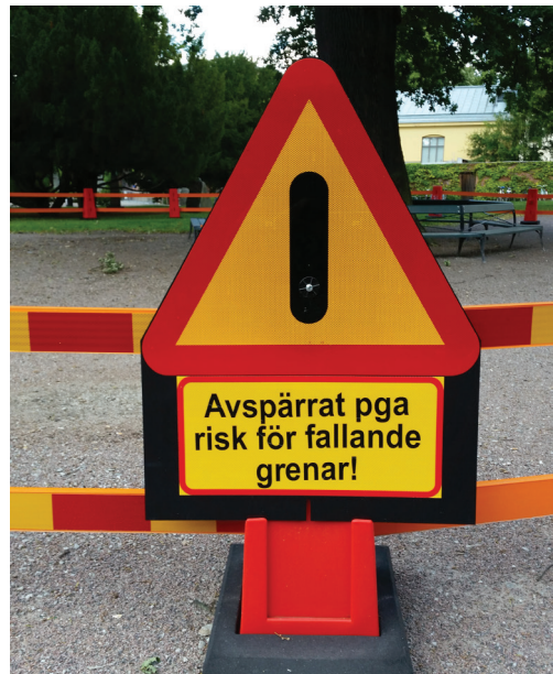
Skadeståndslagen kan vara ett viktigt motiv för att vilja utföra en åtgärd på ett riskträd.

Du som förvaltare bör ange för- och nackdelar med olika lösningar och varför den föreslagna åtgärden bedöms vara den mest lämpliga. En redovisning av alternativa lösningar underlättar en så kallad rimlighetsbedömning som kan behövas bland annat för att leva upp till miljöbalkens allmänna hänsynsregler.