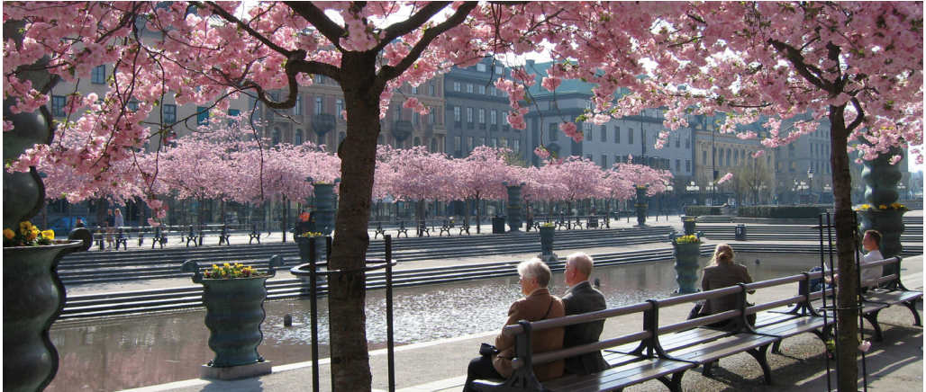
Blommande Prunus 'Accolade' i Kungsträdgården i Stockholm – en estetisk upplevelse som varje vår lockar mängder av besökare.

också viktiga för till exempel fladdermöss och hålläckande fåglar. Orsaken till artrikedomen är framförallt att ett gammalt träd kan erbjuda en mängd olika miljöer. Trädet kan vara knotigt, ha skrovlig bark, håligheter och döda vedpartier. Att träd i offentliga miljöer är så viktiga för den biologiska mångfalden beror på att gamla, grova och ihåliga träd har blivit en bristvara på många andra håll.