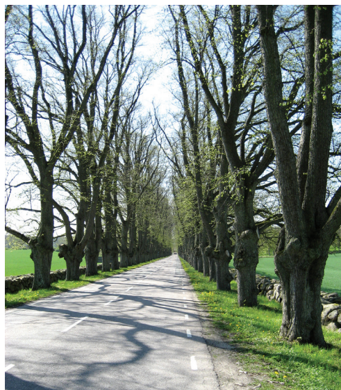
Allé vid Övedskloster i Skåne – en miljö med höga kulturhistoriska värden.

Efter att området som helhet bedömts är det dags att bedöma de träd som ska åtgärdas för att se vilka värden de har, se checklista steg 7 D-F .