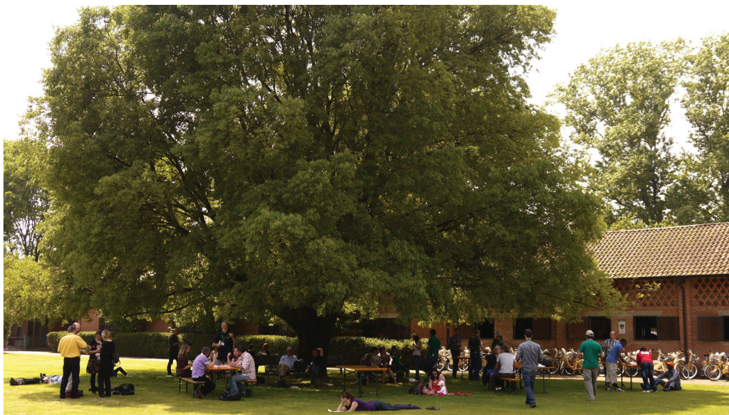
Illustration av ekosystemtjänster: ett träd med temperaturreglerande funktion blir en social möteplats.