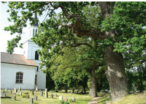
I kulturhistoriskt intressanta miljöer, som på äldre kyrkogårdar och begravningsplatser, har träden ofta höga värden.

I vägledningen presenteras en modell som är tänkt att ge stöd till dig som förvaltare och till myndigheter i att i varje enskild situation välja eller fatta beslut om den mest lämpliga åtgärden utifrån miljöns och trädens olika värden, gällande bestämmelser och förutsättningar på platsen. Modellen är ett stegvis arbets sätt som inleds med en beskrivning av förutsättningarna på platsen och av olika åtgärdsalternativ. Därefter görs en bedömning av trädmiljöns och trädens olika värden innan en slutgiltig sammanvägning görs för att landa i valet av en specifik åtgärd.