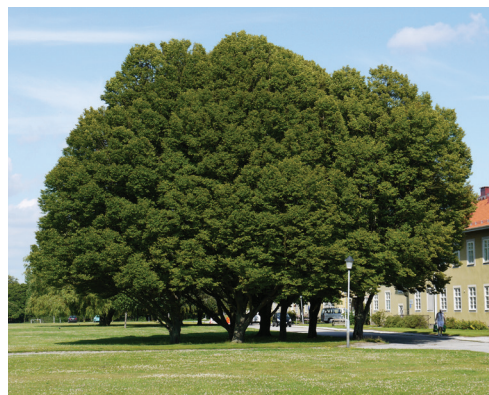
Trädsamling som har värde genom att skapa en rumslig uppfattning av platsen.

Förutsättningarna på platsen sätter ibland gränser för vad som rent praktiskt är möjligt att genomföra och i vilken utsträckning det finns möjlighet att ta hänsyn till de olika värdena. I juridiska ärenden är det lagstiftningen och dess tolkningsutrymme som sätter ramarna.