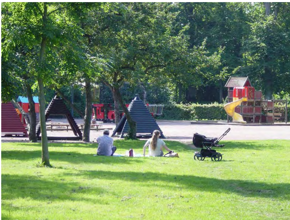
Figur 1. Lekplatsen som utflyktsmål

Förutom som plats för lek kan lekplatsen även ha andra viktiga funktioner. En av dem är som mötesplats och startpunkt för utomhuslek också lyfts fram (Gehl, 1971/2003; Naylor, 1985). En annan kan vara som anledning till att locka barn och vuxna till att vara utomhus tillsammans samt att fungera som utflyktsmål för barngrupper, familjer med mera (Figur 1).