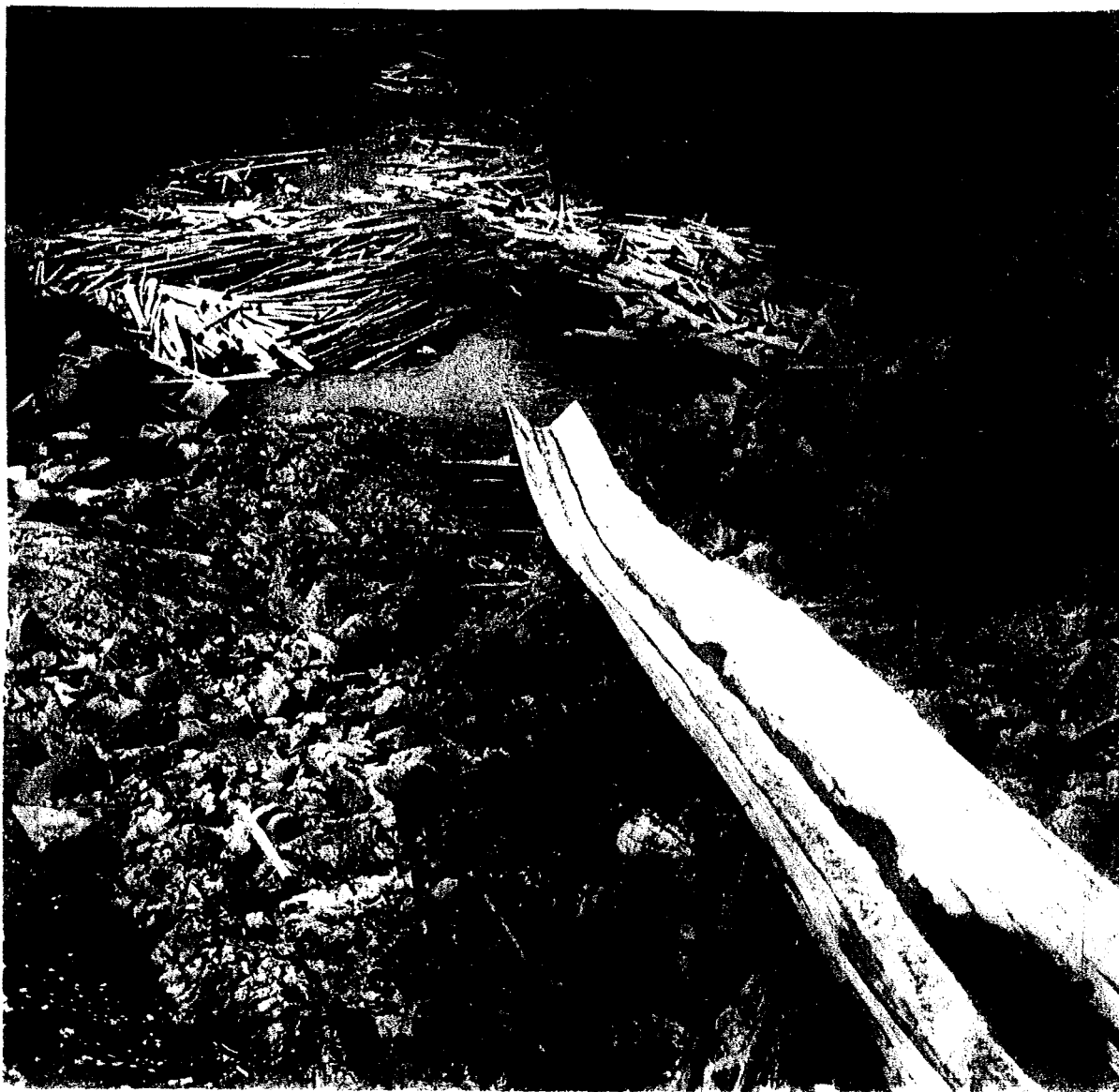
Timmerrännan vid det som en gång var fallet i Hyltebruk.