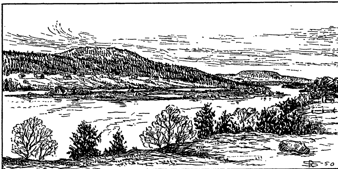
Figur 1. Byn Vindelgransele har ett utpräglat öläge i ett sel i Vindelälven. Ur Rudberg (1957).

I södra delen av Lycksele lappmark (mot Stöttingfjället) dominerar lidbebyggelsen. Upp mot fjällen överväger rena sjölägen och sjölidlägen. Ofta återfinns sjölidlägena på sydsidan medan det på nordsidan vanligen är fråga om uddlägen. I den relativt lågt liggande terrängen mellan och längs Ume- och Vindelälvarna är lägena mer varierade och det är svårare att generalisera. Sjölägen tycks dock inte ha spelat någon större roll i skogslandet (Rudberg 1957).