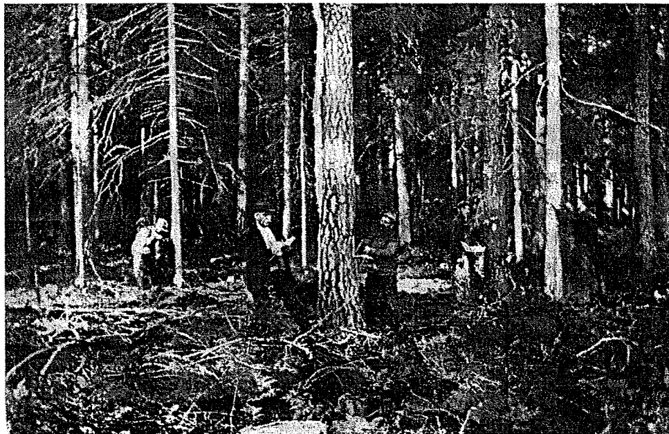
Skogen skulle mätas för att avverkningsmängderna skulle bli de rätta.

skogen sedan vore likvärdig skulle denna delägare inhösta sex gånger så mycket om fastigheten var belägen i Rasbo mot om den återfanns i Ärlinghundra härad.