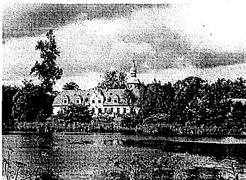
Toppeladugård, belägen strax väster om Genarp