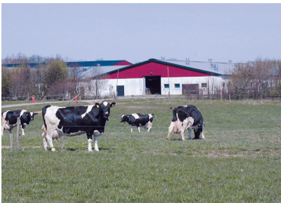
Miljötilståndsprövning görs för att bedöma om den sökta verksamheten har godtagbar miljöpåverkan.

En ansökan om miljötilstånd ska förutom administrativa uppgifter om sökanden och om verksamheten, även innefatta en miljökonsekvensbeskrivning (MKB). I figur 1 visas en översikt över hur tillståndsprövningen går till. För att utreda var i processen problemen finns, genomfördes under hösten 2008 en intervjuundersökning för att kartlägga åsikter och synpunkter hos berörda som representerar de olika delarna av tillståndsprövningen. Från Länsstyrelsen i Skåne intervjuades fem personer som arbetade eller hade arbetat med handläggning av miljötilståndsärenden på Miljöavdelningen under de senaste två åren, samt två personer från Miljöprövningsdelegationen (den fristående myndighet som tar det slutliga beslutet om tillstånd ska ges eller ej). De handläggare som idag arbetar med miljötilståndsprövning för djurhållande lantbruk ingår