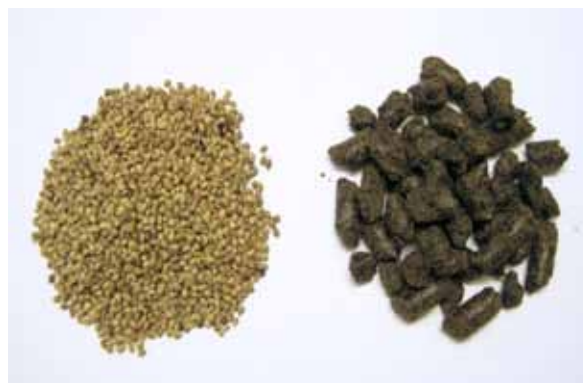
Figur 1. Hampfrö (till vänster) och kallpressad hampfrökaka (till höger).

0, 143, 233 eller 318 g hampfrökaka per kg torrsubstans (ts). Koncentrationen av råprotein i foderstaterna varierade från 126 till 195 g/kg ts från den lägsta till den högsta inblandningen. Kornen gick i lösdrift och hade fri tillgång till respektive foderstat som utfodrades som fullfoder. Mjölka-vkastning och foderkonsumtion registrerades automatiskt och mjölkprover togs varje vecka för att analysera halterna av fett, protein och laktos.