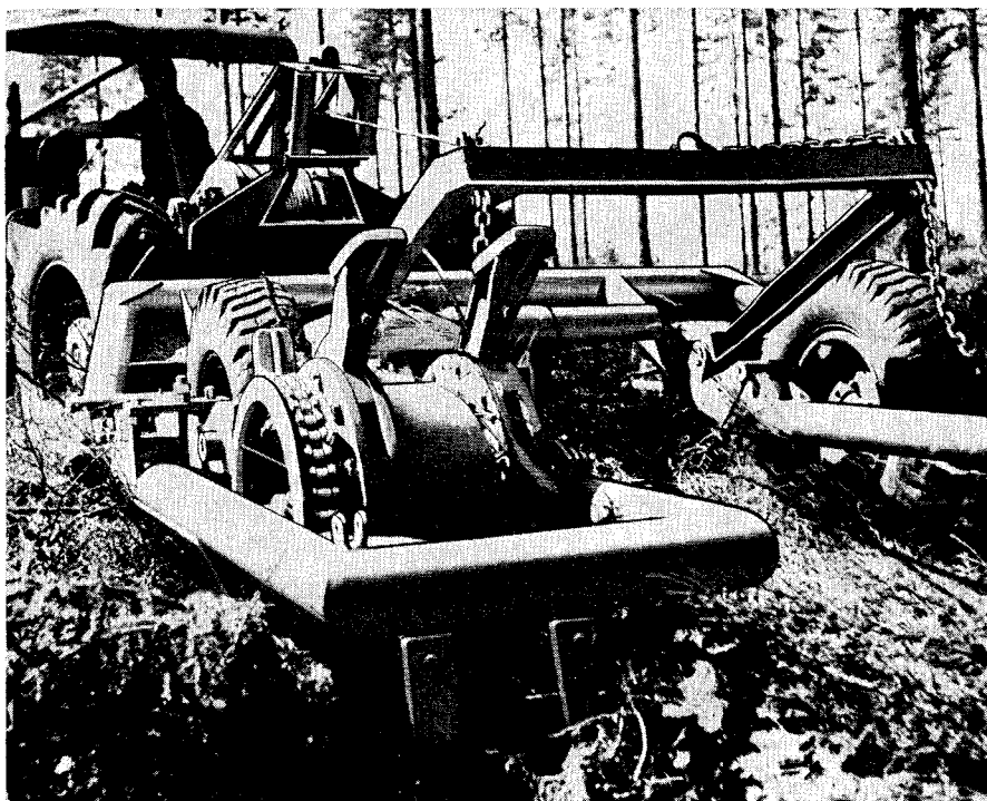
Fig. 2. The SFI-Scarifier in action

wheel. This automatically gives the scarification which is required, and the sod and brushwood are left between the scarified patches.