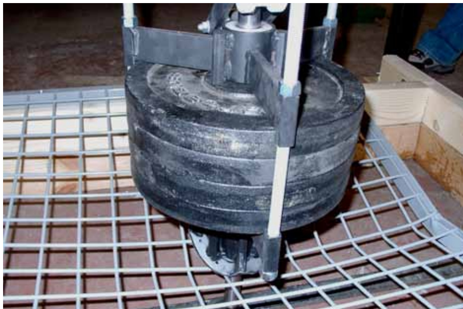
Figur 6. Fallhejarhuvudet, med påmonterad hästsko, i samband med provning av stålträdsnät 50 x 5 mm för 910 J.

En prototyp till laboratorieapparat, "sparksimulator" (figur 5) för testning av inredningsdetaljer utvecklades. Den består av en hästskoförsedd fallhejare (figur 6), som kan förses med olika stor belastning och släppas från olika höjd mot detaljen som skall provas. På så sätt kan anslagsenergi och impuls varieras. Genom att placera mätväggen i sparksimulatorn och göra registreringar för olika fallhöjd och vikt kunde man jämföra mätvärden erhållna i fältförsöken med dem i simulatoren. Ett samband erhöles mellan fallhejarens teoretiska rörelseenergi och anslagsimpuls och de mätvärden som registreras med hjälp av mätväggen. Detta utnyttjades för kalibrering av mätväggen