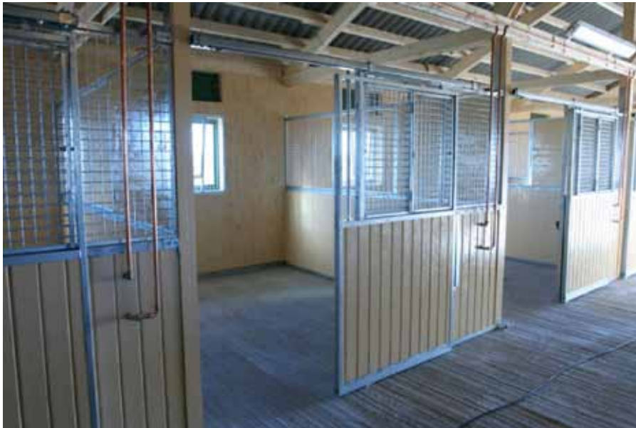
Figur 7. Användning av nät i boxinredningen och framför fönstret ger en säkrare miljö för häst och skötare (AB Bruksbalken).

sparkar kan åstadkomma kraftigare sparkar än vad som registrerades i studien. Det kvarstår alltså i så fall en viss, om även en liten risk, att inredning och byggnadsdetaljer som motstår 150 Ns eller 350 J inte motstår enskilda kraftiga sparkar.