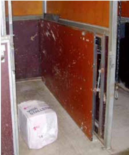
Figur 2. Mätväggen placerad i en hästbox.

med hjälp av en "mätvägg" med lastgivare och datoriserat mätsystem (figur 2) som monterades upp i ett antal häststallar. Med dataunderlaget från mätningarna som grund utvecklades en laboriemetod för provning av inredningsdetaljer. Samtidigt uppställdes förslag på vilka hållfasthetsvärden man bör kräva för inredningsdetaljerna.