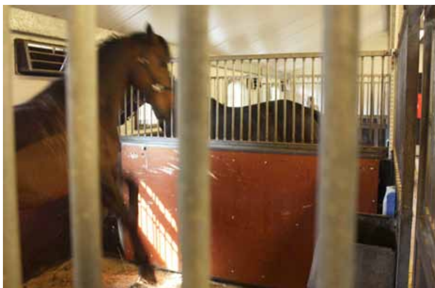
Figur 1. Traditionellt hästboxsystem.

I den genomförda undersökningen var syftet därför att betydligt minska risken för skador på och olyckor med häst orsakade av hästsparkar mot inredningen. Skaderisken för såväl häst som skötare måste minimeras genom en korrekt hållfasthetsdimensionering och lämpligt val och utformning av byggnadsmaterial. Detta gäller oavsett om hästar hålls i enhästboxar eller i grupp i lösdrift. Problemet med underdimensionerade galler till hästboxar har på senare tid diskuterats, delvis mot bakgrund av djurskyddsbestämmelserna, men även genom att industri och tillverkare saknar riktlinjer då man skall utveckla och anpassa byggdetaljerna.