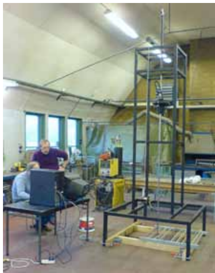
Figur 5. Prototyputrustning för laboratorieprovning, "sparksimulator".

hästspark, uppgick till 8722 N. Tar man hänsyn till tidsförloppet för stöten, så var det högsta registrerade impulsvärdet orsakad av spark 131 Ns (Newtonsekunder) vilket motsvarar ca 300 J (Joule) anslagsenergi (figur 4).