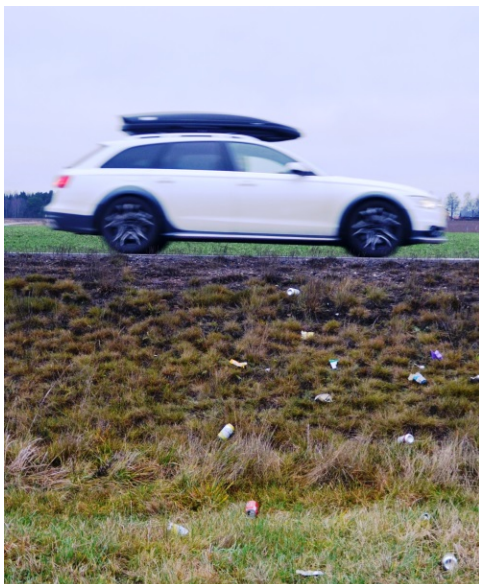
Bild 2. Burkar och skräp kastas från bilar och landar på intilliggande vallar.

Intervjuerna visade att på alla gårdar utom två användes stationär foderblandare eller mixervagn vid utfodring. På de gårdarna utfodrades det med plansiloensilage uttaget direkt ur plansilon och placerat på foderbordet med hjälp av blockuttagare eller med rundbalar. Tre vallskördar per säsong var vanligast, på en gård togs fyra och på två av gårdarna togs två vallskördar per säsong. Antalet skördar verkade dock inte påverka hur många djur som drabbades av vasst.