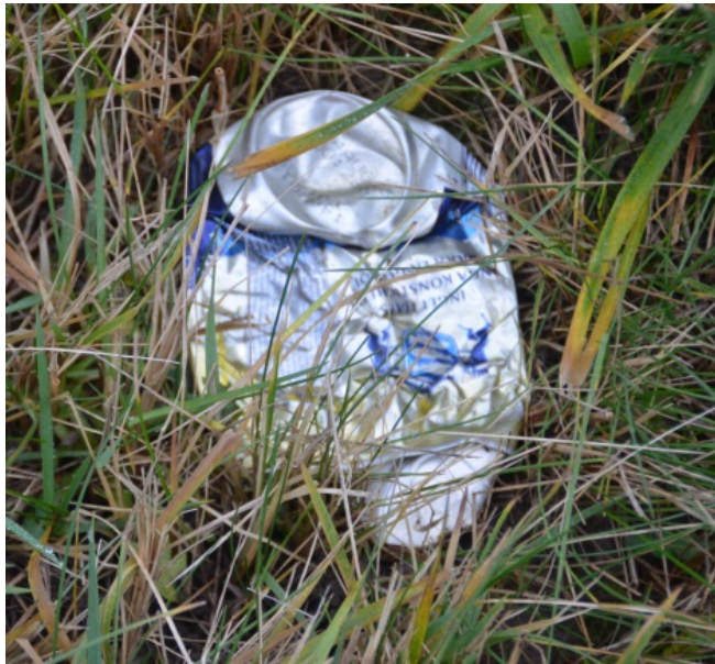
Bild 3. Alla intervjuade ansåg det viktigt att plocka skräp före och under respektive vallskörd. En risk med vältning av vallen kan vara att den tillplattade aluminiumburken plockas upp igen av vallmaskinerna och följer med in i grovfoderkedjan.

Förebyggande arbete vid vallskörd förekom på alla gårdar. Alla intervjuade ansåg att det var viktigt att plocka skräp före och under respektive vallskörd. I intervjuerna framgick att det var diken vid skiften nära trafikerade vägar som skräpades ner mest. Flera av de intervjuade misstänkte att vinden skulle föra skräpet från diket ut på vallen om det inte plockades upp. På tre av gårdar ringvältades vallarna för att trycka ner sten och eventuellt skräp i marken.