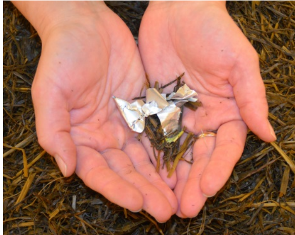
Bild 1. Aluminiumskärivor är svåra att upptäcka i ensilage.

Veterinärbesök vid misstänkt vasst uppgavs kosta i medeltal 1 800 kr med en variation mellan 1 000 till 3 000 kr. Totalkostnaden för en nödslaktad ko varierade mellan 1 500 kr till 23 000 kr. I den lägre summan ingick endast avlivning och bortforsling av kadavret medan det i den högre summan hade tagits hänsyn till produktionsbortfall.