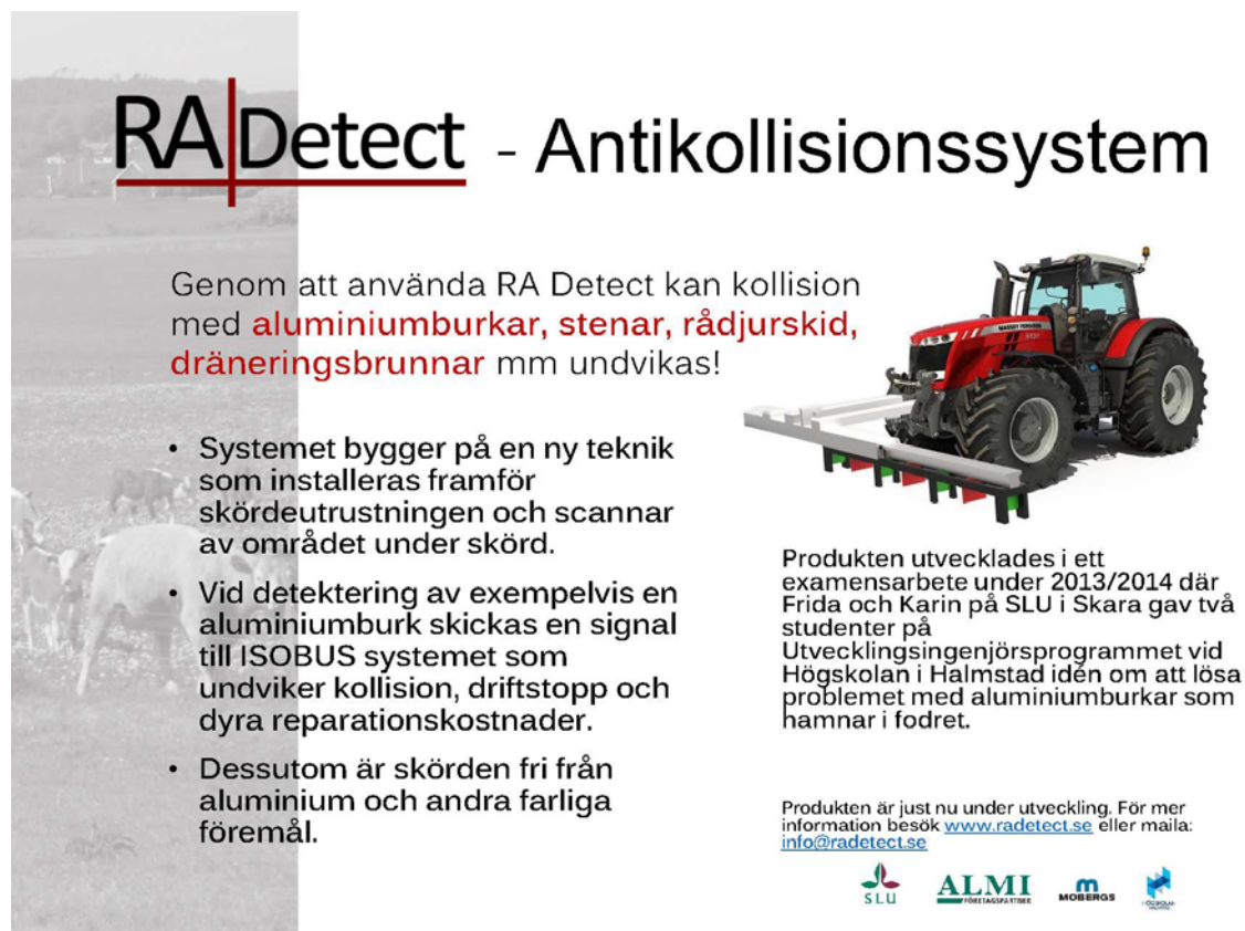
Bild 6. Posterpresentation som visades under Smedjeveckan i september 2014 på Götala nöt- och lammköttscenrum.

Förutsatt att finansiering kan lösas är målsättningen att testa utrustningen i fält vid SLU i Skara för att finjustera och utvärdera funktionen att få skörden fri från aluminium och andra farliga föremål så som stenar, rådjurskid, dräneringsbrunnar mm.