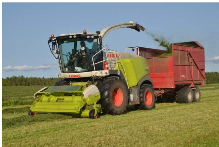
Bild 4. Vallodling utmed trafikerade vägar och ombyggnationer av ladugårdar är troliga orsaker till att nötkreatur drabbas av vasst.

Stordjursveterinärerna i Vara uppskattade antalet misstänkta fall av vasst till mellan 70 och 80 per år. Fallen kunde relateras till gårdar som har vallodling intill större vägar. De obducerar 10 fall per år och hittar då aluminiumrester och spik.