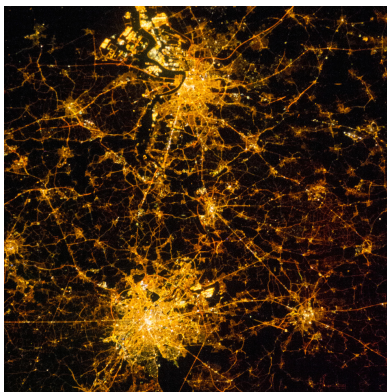
Ekosystemet för forskning kräver samarbete.

Kungliga biblioteket fick under våren 2013 ett uppdrag från regeringen att vidareutveckla databasen SwePub för att möjliggöra och kvalitetssäkra bibliometriska analyser på nationell nivå. SwePub är en nationell databas för material publicerat av forskare vid svenska högskolor och universitet. Kortfattat kan sägas att lärosäten som är deltagare i SwePub levererar data till databasen från sina lokala publikationsdatabaser.