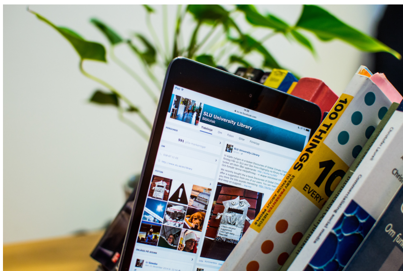
SLU-bibliotekets facebookside.

– I årets arbete med strategin för våra kommunikationskanaler har fokus i stället varit att titta närmare på våra specifika kanaler, t.ex. vår webbplats, Facebook, Twitter, nyhetsmejl m.fl. Det har varit viktigt att vi som arbetar med de olika kanalerna har en gemensam bild av dem och gemensamma mål att sträva efter. Strategin svarar på frågor som: Vad är syftet med vårt nyhetsmail? Vilken typ av information vill vi förmedla via Twitter och till vem? Är målet att skapa dialog via Facebook eller har vår närvaro där ett annat syfte? Vad är viktigt när vi arbetar med att utveckla vår webbplats? Vad har vi för vision med vårt kommunikationsarbete? Våra forum för kommunikation skiljer sig åt en hel del och det är viktigt att vi inte slentrianmässigt förmedlar samma sak på alla ställen utan någon eftertanke.