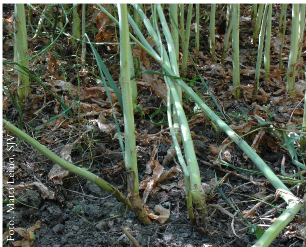
Stjälkbrott till följd av angrepp av torröta.

Nekroserna på stjälken börjar som svartlila