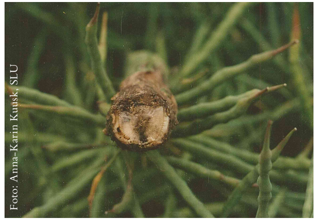
Djupgående angrepp på rothalsen. Fotograferat 3 veckor innan skörd.

flammiga fläckar ofta i anslutning till insektsnag, bladarr eller någon mekanisk skada. Längre fram på våren och sommaren blir fläckarna större, mer utdragna, ljusgrå till ljusbruna och omgivna av en skarp mörk kant. I mitten av skadan kan man ofta med lupp eller blotta ögat urskilja de svarta pykniderna. Fläckarna sitter vanligtvis långt nere på stammen men angrepp högre upp på plantan förekommer också. Mot slutet av säsongen kan hela nedre delen av stjälken täckas av pyknider och vävnaden under epidermis blir ofta mörkfärgad. Det är också några veckor innan skörd som de mer allvarliga djupgående angreppen nere vid rothalsen börjar framträda. Dessa skador kan graderas efter en fransk skala som ger ett mått på hur djupt svampen har trängt in i stjälken.