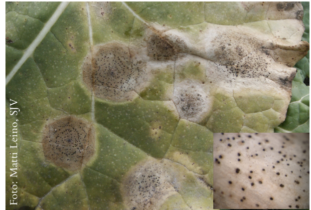
Bladfläckar av övervintrad torröta. Observera de svarta pykniderna i mitten av fläckarna (i förstoring).

Zealand. L. maculans är en ascomycet och tillhör klassen Dothideomycetes, ordningen Pleosporales. Andra viktiga växtpatogener inom Pleosporales är arter inom Alternaria , Botrytis och Mycosphaerella . I Sverige benämns svampen vanligen för Phoma lingam . Framförallt i Europa finns även den närbesläktade L. biglobosa som gärna trivs tillsammans med L. maculans . Tidigare var L. biglobosa och L. maculans uppdelade i en B och A grupp av L. maculans men de är idag klassificerade som två olika arter. En sedan länge använd metod att särskilja olika isolat är att klassificera dem i tre patogenitetsgrupper beroende på hur allvarliga skador de ger på hjärtbladen av speciella rapssorter (Westar, Glacier och Quinta).