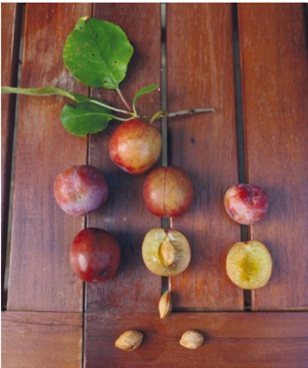
Goda röda krikon från de blommande träden ovan. Den här sorten är spridd i och kring Uppsala på många ställen. 25 augusti 2009.