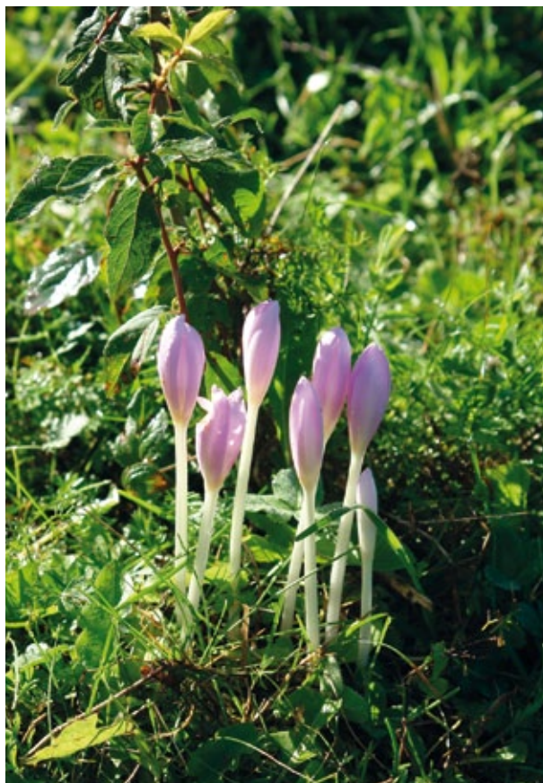
På strandängar nära Stenige slott finns naturreservatet Västerängsudd med en sedan gammalt känd lokal för tidlösa. Växten har spritt sig från slottsträdgården ut på de betade strandängarna vid Mälaren och nämns därifrån i en publikation redan 1843. Här har nog både fröspridning och vegetativ spridning av lökar förekommit. En stor färgvariation har noterats från violett över blekviolett till rent vitt. 16 september 2006.

Växter kan också hamna i väglänter genom sådd av gräsfröblandningar. Ett antal exotiska ärtväxter har till exempel hittats av Örjan Nilsson på väglän-