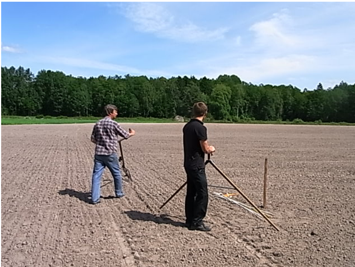
Försökspersonal mäter in sortförsöket i Nybro, Kalmar län.

Det var tre sorter där graderingen av uppkomst visade på dålig etablering. Det var SWBamse, SWRF5010 och SWRF5037. Uppkomsten var sämst i Jämtland men samma sorter var också något sämre i Kalmar län.