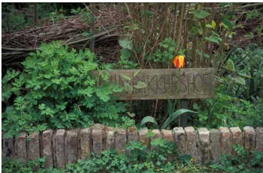
Bickershof i Utrecht i Holland.

Trädgården är ungefär 3000 kvadratmeter stor, omgärdad av ca 100 år gamla två- och trevåningshus, med totalt ca 50 invånare. De boende i Bickershof samarbetar med kommunen, kommunen äger nämligen marken, trots att gården ligger inne i ett kvarter, omringad av privatägda hus. I ett kontrakt förbinder sig de boende genom sin förening att sköta, underhålla och utveckla Bickershof. Kommunen bidrar med en liten summa (ca 6000 kronor) per år i driftbudget. Från början tilläts den här långtgående självständigheten som ett experiment från kommunens sida. Men efter att de boende anlitat en konsult, som räknade om alla olika typer av investeringar, som de boende gjort, i pengar, blev kommunen mer intresserad. Experimentet förbyttes till strategi hos kommunen. År 2004 fanns det ca 600 efter