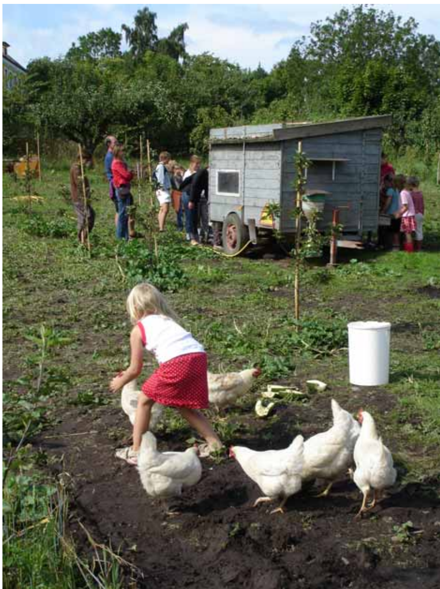
Mandelmanns Trädgårdar i Rörum.

växthus för tomater och ett för människor. I växthuset för människor ordnas musikkvällar, teaterföreläsningar och andra evenemang. För kulturprogrammet på somrarna ansvarar Kulturföreningen Mandelmanns Trädgårdar, en vänförening i vilken kvinnan i familjen är med i styrelsen.