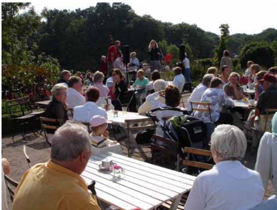
Musikafton i Slottsträdgården.

Föreningen Slottsträdgårdens vänner, som har ca 450 medlemmar, driver kaféet och arrangerar musikkvällar, skördefest och andra evenemang som är mycket populära. Man kan sitta ner i kaféet och ta del av atmosfären i trädgården, även om man inte har tid eller lust att ta del i själva trädgårdsarbetet. Besökare är välkomna att delta i det praktiska trädgårdsarbetet, så som tanken var hos initiativtagarna, men det sker sällan. Det är inte heller många medlemmar i Slottsträdgårdens vänner som tar aktiv del i trädgårdsarbetet.