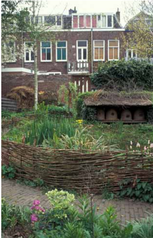
Bickershof i Utrecht i Holland.

innan marken var färdigsanerad. Det fanns gott om tid till planering och projektering av hur gården skulle se ut. Kommunens landskapsarkitekt höll i planeringen. De boende fick vara med och ha önskemål på traditionellt sätt. 1986 kunde gården invigas. De boende nöjde sig dock inte med detta, de önskade att själva kunna prägla och utveckla gården. Efter att ha utmanat politiker i debattartiklar och skapat en opinion, så lyckades de boende få tilldelat sig ansvaret för området. Men som ett experiment, var kommunen noga med att påpeka.