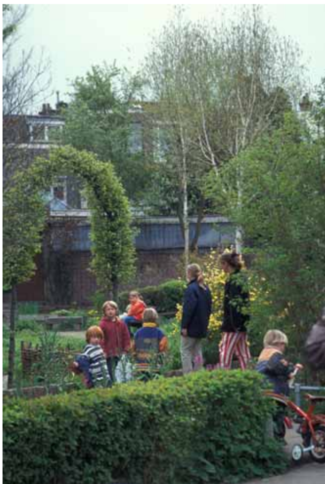
Bickershof i Utrecht i Holland.

följare till Bickershof i Utrecht, enskilda individer eller sammanslutningar av medborgare som har ett kontrakt med kommunen om skötsel av sitt närområde.