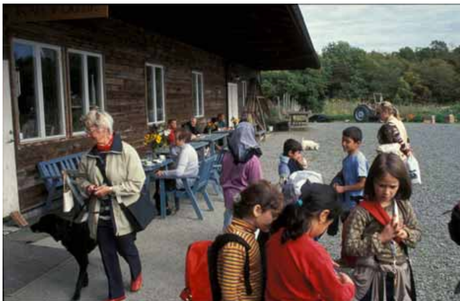
Lärjeåns Trädgårdar i Angered.