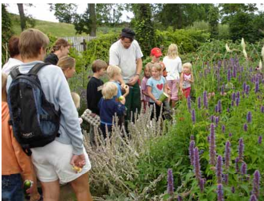
Trädgårdsmästaren i samspråk med barnen.