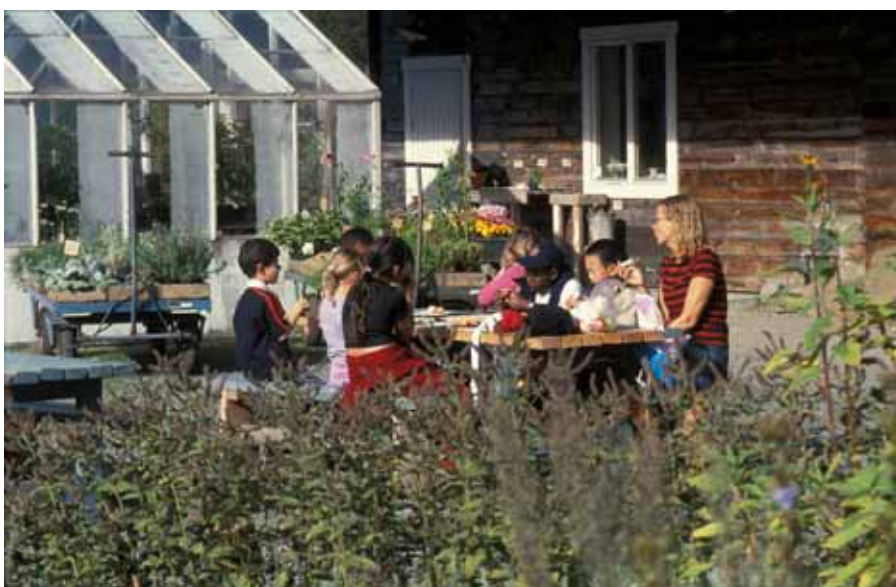
Lärjeåns Trädgårdar i Angered. En skolklass provsmakar äpplesorter.