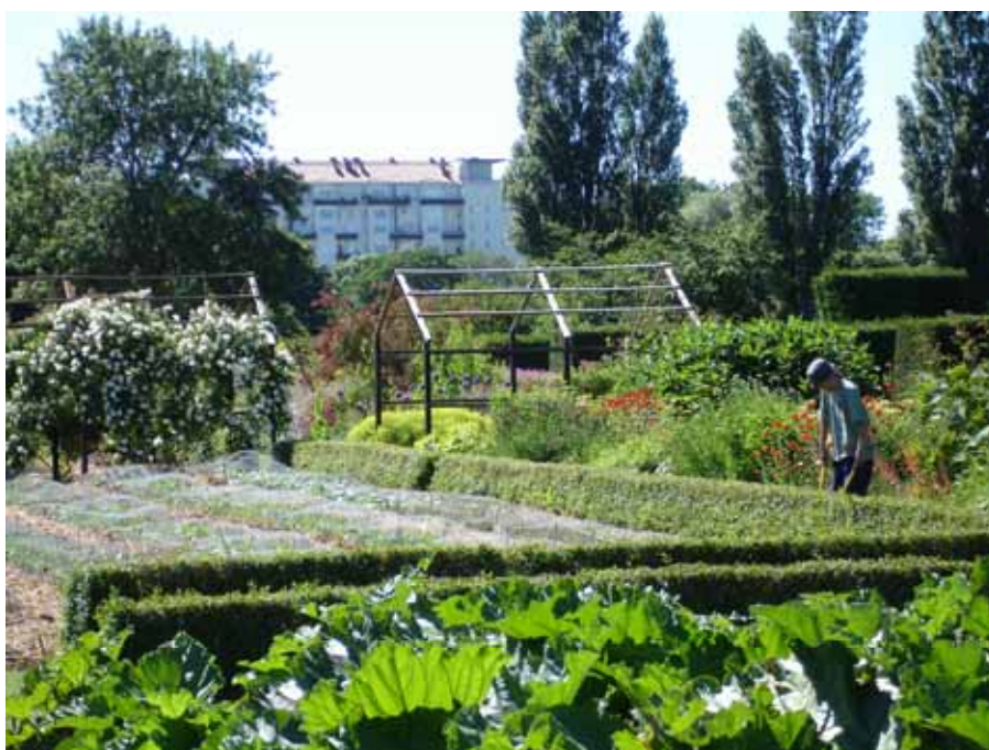
Slottsträdgården i Malmö.

Förändringen kom när en trädgårdsmästare blev medlem i föreningen ungefär samtidigt som en annan av föreningens medlemmar, en landskapsarkitekt, visade upp en professionell plan för trädgårdens utseende och form. 1997 nåddes en samarbetslösning som medgav Stadsmiljöavdelningen insyn och inflytande över driften av trädgården genom bildandet av en samverkansförening (föreningen Slottsträdgården), med representanter för föreningen Slottsträdgårdens vänner, Stadsmiljöavdelningen och trädgårdens anställda. Då snabbades anläggningsarbetet upp, bl.a. med hjälp av arbetskraft via arbetsmarknadsåtgärder. Tyngre anläggningsarbeten utfördes av den av kommunen anlitade utförarenheten, finansierat av Stadsmiljöavdelningen. Medlemmarnas ideella arbetsinsatser minskade i takt med att trädgården snabbt antog färdig form. Slottsträdgården är tolv tusen kvadratmeter stor