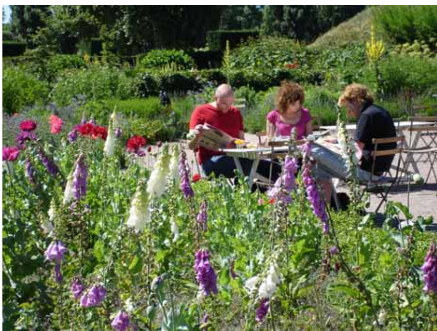
Slottsträdgården i Malmö.

Idén och initiativet till Slottsträdgården togs 1994 av en grupp malmöbor, som inte hade någon professionell trädgårdsbakgrund. De ville skapa en ekologisk oas i sin närmiljö, med möjlighet för malmöbor att sticka fingrarna i jorden, odla, kompostera och umgås. Tanken var att alla intresserade skulle kunna få vara med och odla. Förebilden var organisationen Green guerillas och deras skapande av community gardens i New York. Initiativtagarna tyckte att kommunens nedlagda plantskola var en bra plats och tog kontakt med Stadsmiljöavdelningen i Malmö stad. Tjänstemännen på Stadsmiljöavdelningen förhöll sig avvaktande, dels fanns det andra planer för platsen, dels menade tjänstemännen att det centrala läget kräver kvalitet, dvs. representa-