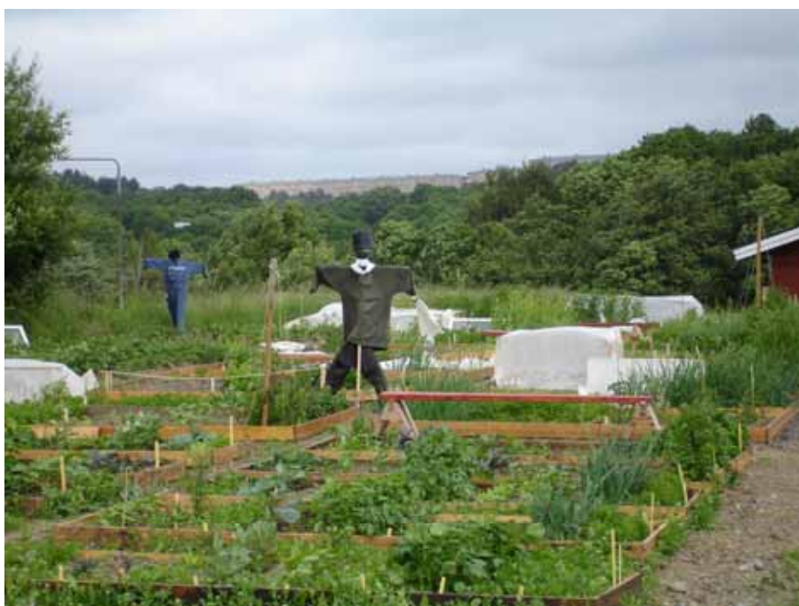
Lärjeåns Trädgårdar i Angered.

Stiftelsen bildades och trädgården kom igång på allvar år 2000 när ett ungt trädgårdsmästarpar flyttade från Stockholm till Angered för att förverkliga en vision i Lärjeåns Trädgårdar. En vision, som presenterats på utställningen "Trädgård till nöje och nytta" redan 1983 i Stockholm och därefter 1984 i Angered. Utmaningen och föresatsen att förverkliga visionen i Angered hade varit levande i 15 år innan de två trädgårdsmästarna introducerades till idén, flyttade dit och började odla marken. De är utbildade odlingspedagoger på Rudolf Steinerseminariet i Skillebyholm, och praktiserade på Rosendals Trädgård i Stockholm under kulturhuvudstadsåret 1998.