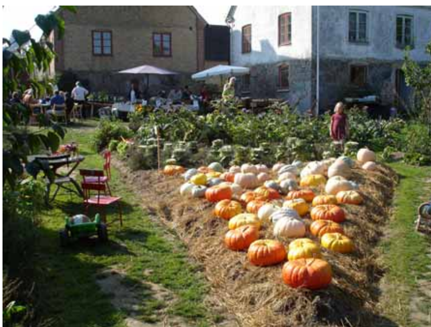
Mandelmanns Trädgårdar i Rörum.