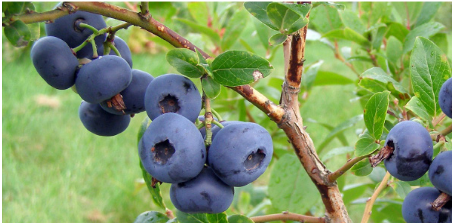
PELLE™ E Foto Kimmo Rumpunen