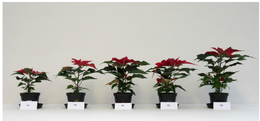
Bild 1: Julstjärna som fått olika mängd fosfor enligt tabell 1 samt 60 kg/m 3 EDR-lera.