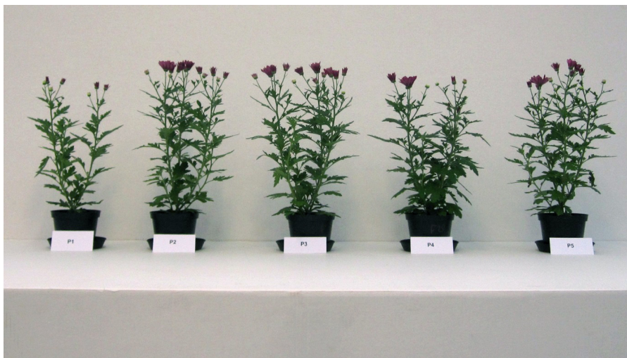
Bild 2: Hos krysantemum avvek endast den lägsta fosforgivan tydligt.

EDR-lera påverkade inte resultatet för krysantemum.