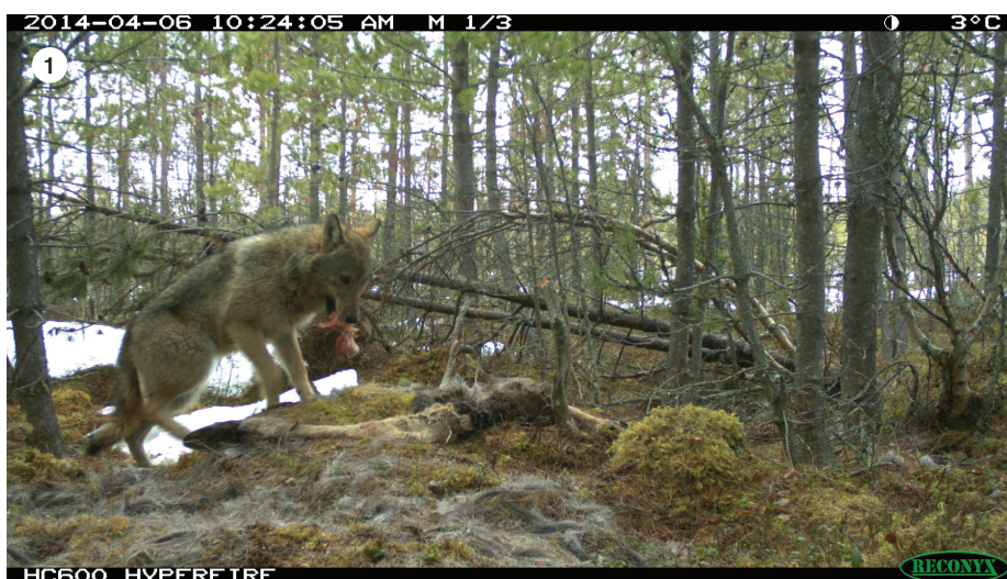
1. En varg besöker en tidigare vargslagen älg i Tandsjön-reviret där en fältkamera var monterad i syfte att registrera besök från olika arter.