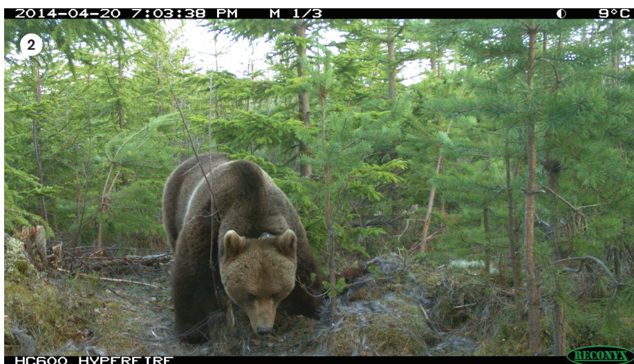
2. En sändarförsedd björn besöker platsen för en tidigare vargslagen älg i Kukumäki-reviret.

Sammantaget visade resultaten att vargarna hade en lägre predationstakt (fler dagar mellan slagna byten) på sitt huvudsakliga bytesdjur i både Skandinavien och Yellowstone när björn var närvarande. Den bakomliggande orsaken till dessa resultat är ännu inte klarlagd och vi följer för närvarande upp denna studie med ytterligare analyser.