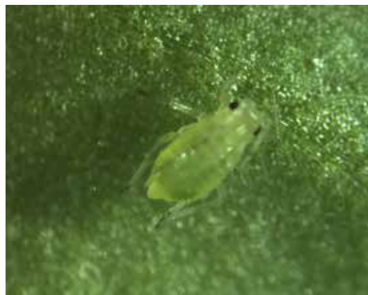
AULACORTHUM, BLADLÖS

I ekologisk produktion av spannmål används biologisk betning eller värmebehandling av utsädet. 25 En stor del av utsädet värmebehandlas med Thermoseed-metoden 26 som innebär att utsädet utsätts för het och fuktig luft i en kontrollerad process. 27 Biologisk betning av spannmålsutsäde med jordbakterien Pseudomonas chlororaphis är också omfattande i ekologisk produktion (Cedomon, Cerall), och produkter baserade på bakterien finns även för betning av utsäde av ärt och morötter (Cedress). Potatisutsäde betas också i viss mån med biologiska medel baserade på mikroorganismer (Bilaga 3).