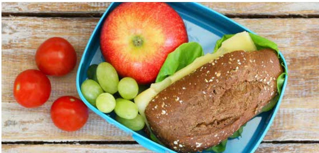
Alla konsumenter i Sverige exponeras för växtskyddsmedel via maten. Ibland finns resthalter i dricksvatten.

arbete mot växthusarbetarens exponering är viktigt även när biologiska bekämpningsmetoder används, särskilt med tanke på att sådana metoder antas få en större spridning i framtiden. Sådant arbete kan omfatta ventilation i växthus, skyddskläder, och appliceringsmetoder som minimerar människors kontakt med medlen.