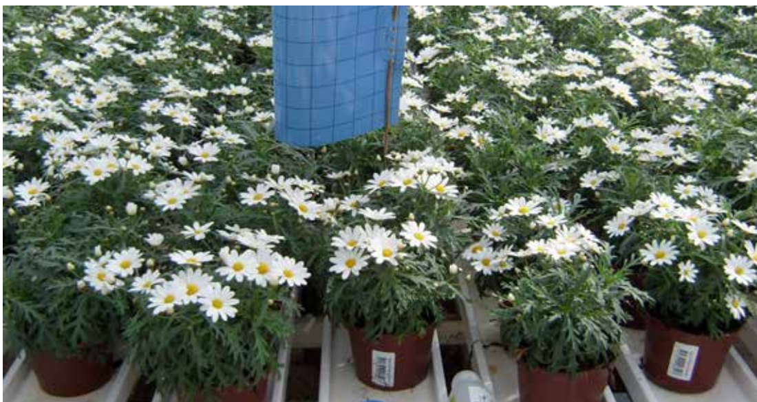
Biologisk bekämpning mot trips görs med en kombination av Orius (rovskepp) och rovskalster. Trips är ett vanligt skadedjur i växthus och övervakas med blå eller gula klisterkivor eftersom tidig upptäckt är viktig.