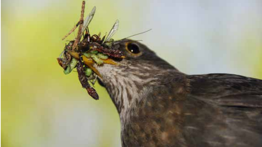
Fåglar påverkas negativt av växtskyddsinsatser på ett indirekt sätt. Genom användning av insektsmedel och bekämpning av blommande växter med ogräsmedel minskar mängden insekter och därmed fåglarnas tillgång på mat

och nedbrytningshastighet är att mäta hur lång tid det tar efter man besprutat grödan tills högst 25 procent av bin som kommer i kontakt med grödan dör (RT25). För pyretriner (utan hjälpämnet piperonyl butoxid, som inte används i pyretrinbaserade växtskyddsmedel i Sverige) är denna tid mindre än två timmar. De flesta syntetiska pyretroiderna har en RT25 på ett dygn eller längre. För spinosad var RT25 mellan tre och 24 timmar, beroende på användning och produkt. 68