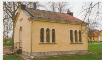
Fig. 2. Arkivet uppfört 1908.