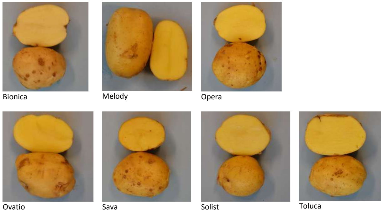
Bild 1. Sorterna som ingick i försöken 2011.

Medelavkastningen på de olika försöksplatserna varierade mellan 25 och 40 ton/ha. Försöket i Dalarna gav högst skörd, en anledning till denna höga skörd var en relativt stor andel stora knölar. Lägst avkastningen hade försöket på Gotland för ovanlighetens skull drabbades försöket tidigt (för Gotland) av bladmögel och snabb nedvissning. Knölskörden redovisas i tabell 3 och figur 1. Resultaten varierade kraftigt både mellan försöksplats och sort, men på alla försöksplatser, utom i Hemse, gav den tidiga sorten Solist högst skörd. Eftersom Solist är en tidig sort hann knölar bli väl stora, men även om man tar hänsyn till detta gav sorten en bra skörd i fraktionen 40-60 mm. Sorten Bionica var också högavkastande både i totalskörd och i fraktionen 40-60 mm. Toluca gav hög skörd, men visade en kraftig benägenhet att för att sätta få knölar som lätt blir förstora och en stor andel av knölar blev större än 60 mm. Toluca var också den sort som var grön längst och med lång inlagring i knölar som följd. Sorterna Opera och Ovatio hade lägre avkastning än mätaren Sava. För den treåriga försöksperioden 2009-2011 visade Bionica, Cicero och Sarpo Mira hög skörd.