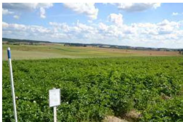
Vikmanshyttan 5 augusti 2011