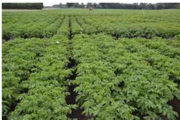
Hemse 2 august 2011