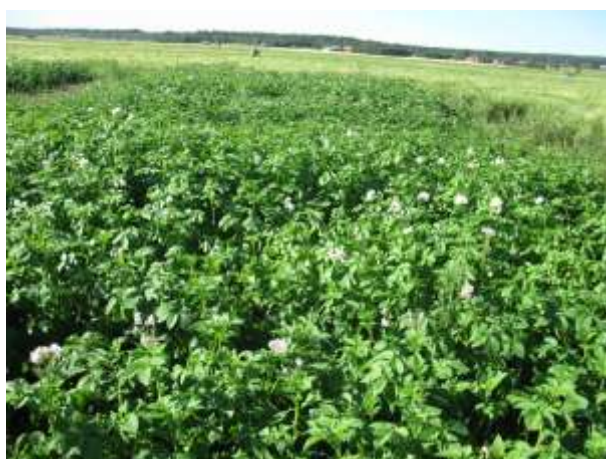
Umeå 17 augusti 2011