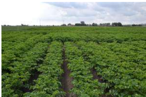
Önnestad 24 juni 2011