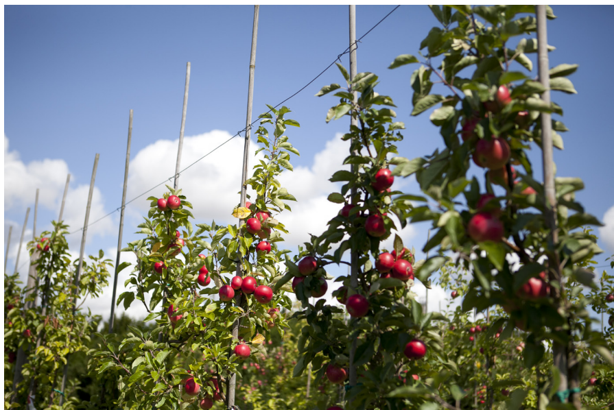
Äppelodling i Trädgårdslaboratoriet vid SLU i Alnarp.

Forskare vid SLU kan tillsammans med partnererna i samverkansorganisationen ansöka om finansiering för FoU-projekt. Ansökningarna prioriteras först i ett ämnesgruppsmöte och sedan fattas ett beslut av styrelsen cirka 6–8 veckor efter ansökningsdatum. Hälften av projektkostnaderna kan ansökas från samverkansorganisationen, och den andra hälften tillförs av partners. Partnererna uppger att forskningsprojekten är värdefulla och besvarar frågor som är viktiga för dem [3, 4]. Det finns dock en potential att engagera partners ännu mer tillsammans med forskare, och tvärtom, till exempel genom att initiera uppföljningar av forskningsprojekten över tid med både partners och forskare [4].