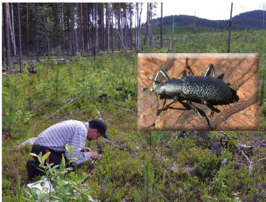
Figur 3. Större svartbagge ( Upis ceramboides , lilla bilden) är rödlistad och försvunnen från södra Sverige. Arten kan gynnas av hyggen med mycket död björkved. Här letar forskarna efter skalbaggen på ett hygge i Norrbotten.