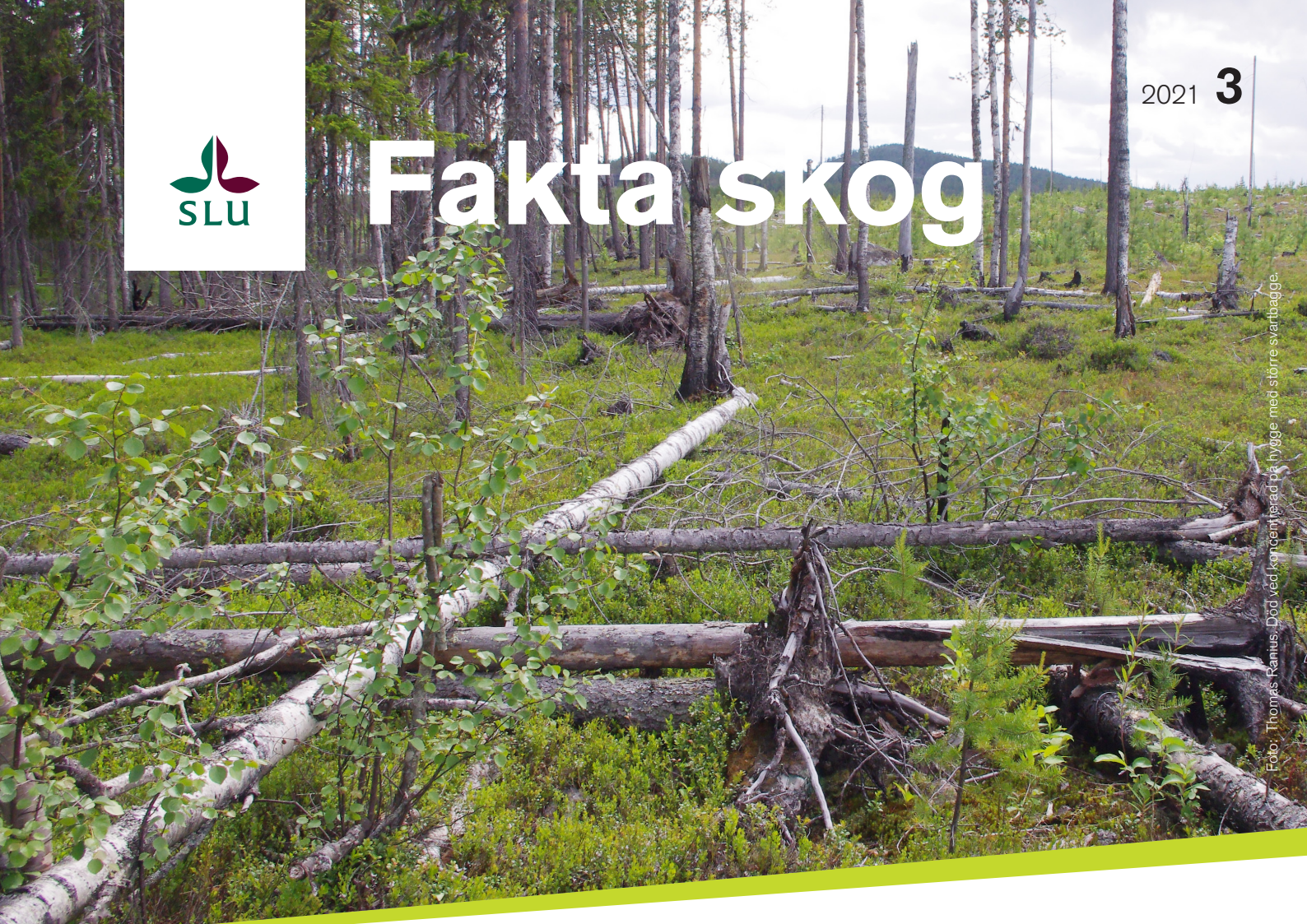
Död ved koncentreras på hygge med större svarbagge.