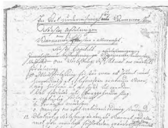
Figur 1. Inledningen till Hernquists handskrift "En kort undervisning för Barnmorskor". (Veterinärhistoriska museet i Skara.)

I den digra samling av handskrifter som Hernquist lämnat efter sig finns ett dokument på hela 68 foliosidor som heter "En kort undervisning för Barnmorskor" (3). Fig. 1. Den har sannolikt tillkommit tidigast 1785 (4).