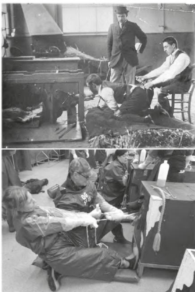
Figur 4. Lådan då och nu.

(innehållande ett riktigt kobäcken samt en läderlivmoder som man lägger kalven i) som ska föreställa kossor. Man får därmed lära sig att lägerätta kalvar som ligger på sniskan och inte kan födas fram på egen hand. Ibland ligger kalven rätt men man måste ändå hjälpa till att dra ut den ifall kossan har för svaga värkar eller för trånga förlossningsvägar. Våldigt praktiskt, väldigt roligt, väldigt kletigt. (9). Fig 4.