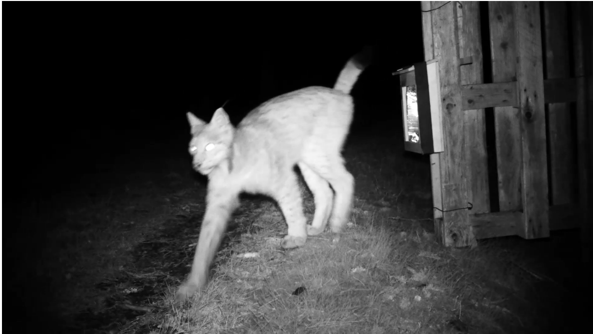
Figur 4. Hårfälla med kardborreband.

Det viktiga är att fånga levande hår med hårrötter, inte bara döda hårstrån som lossnat och sitter kvar i pälsen.