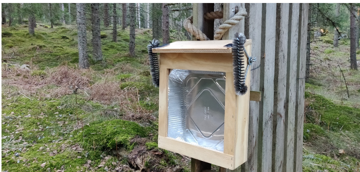
Figur 3. "Urinholk" samt annan variant av hårfällor vid kamerastation.

Aluminiumformen träns in i holken nedifrån och byts ut om ett lodjur kissat på den. Vid sådant tillfälle måste även hårfällorna bytas då de kan ha blivit kontaminerade av urin. Om ett lodjur bara gnuggar sig utan att kissa behöver aluminiumformen inte bytas ut.