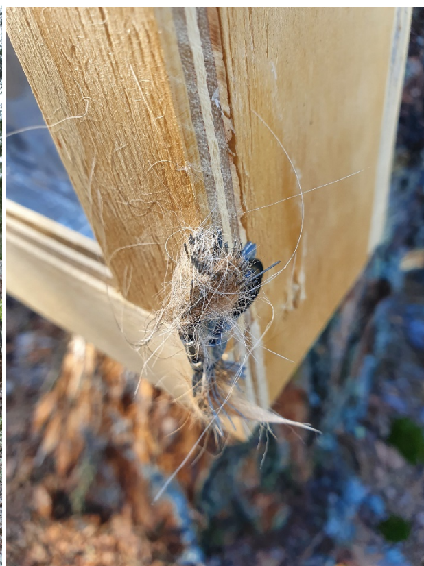
Figur 1. "Urinholk" och hårfälla (i nedre högra hörnet).