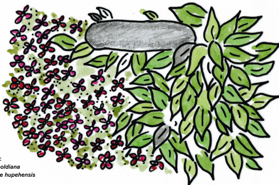
Inspiration tema Skog: Perenner – Hosta sieboldiana (daggfunkia), Anemone hupehensis (höstanemon)

Det kändes naturligt att välja skogen som tema och gestalta den i några av förslagen. Skogen kan för många människor bidra till ett lugn, en stunds stilla flykt från verkligheten när man vilar benen sittande på en stubbe eller sten. De gröna färgerna på trädens blad och barr, de brun- och gråaktiga färgerna på stammar och grenar utgör basen. Kanske upptäcker besökaren när hon tittar sig omkring