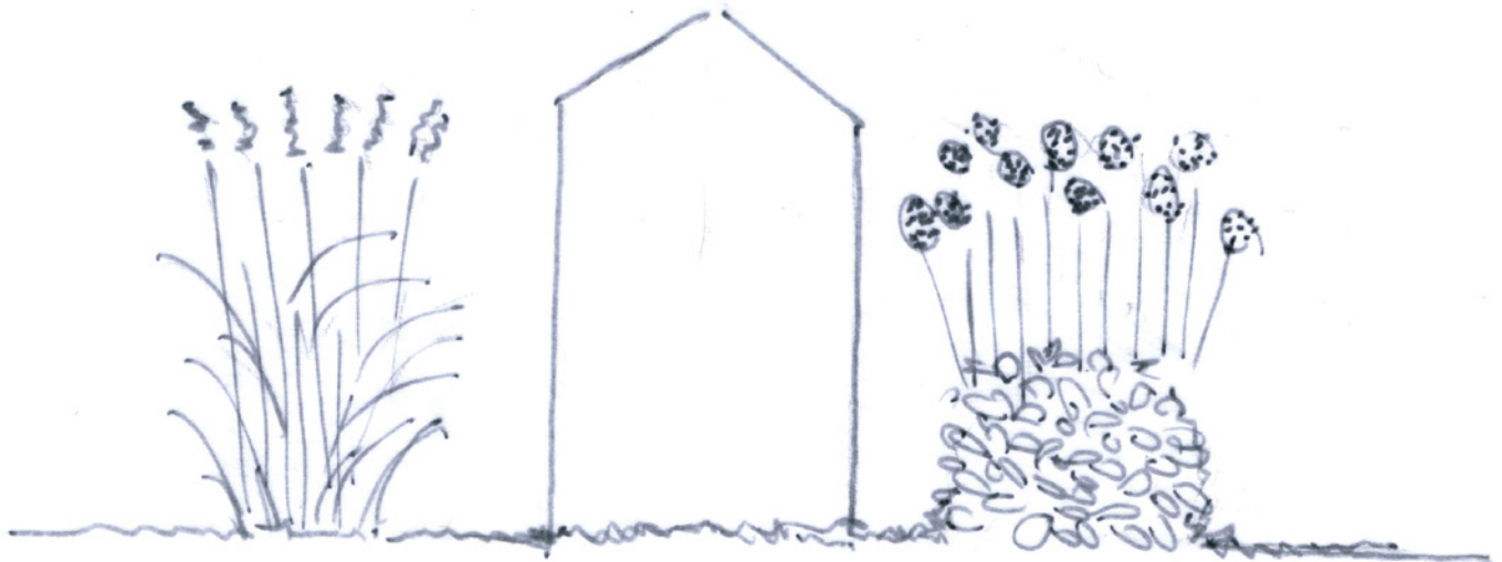
Inspiration tema Strand: Perenner – Echinops ritro (blå bolltistel), Miscanthus sinensis 'Kleine Fontäne' (elefantgräs)