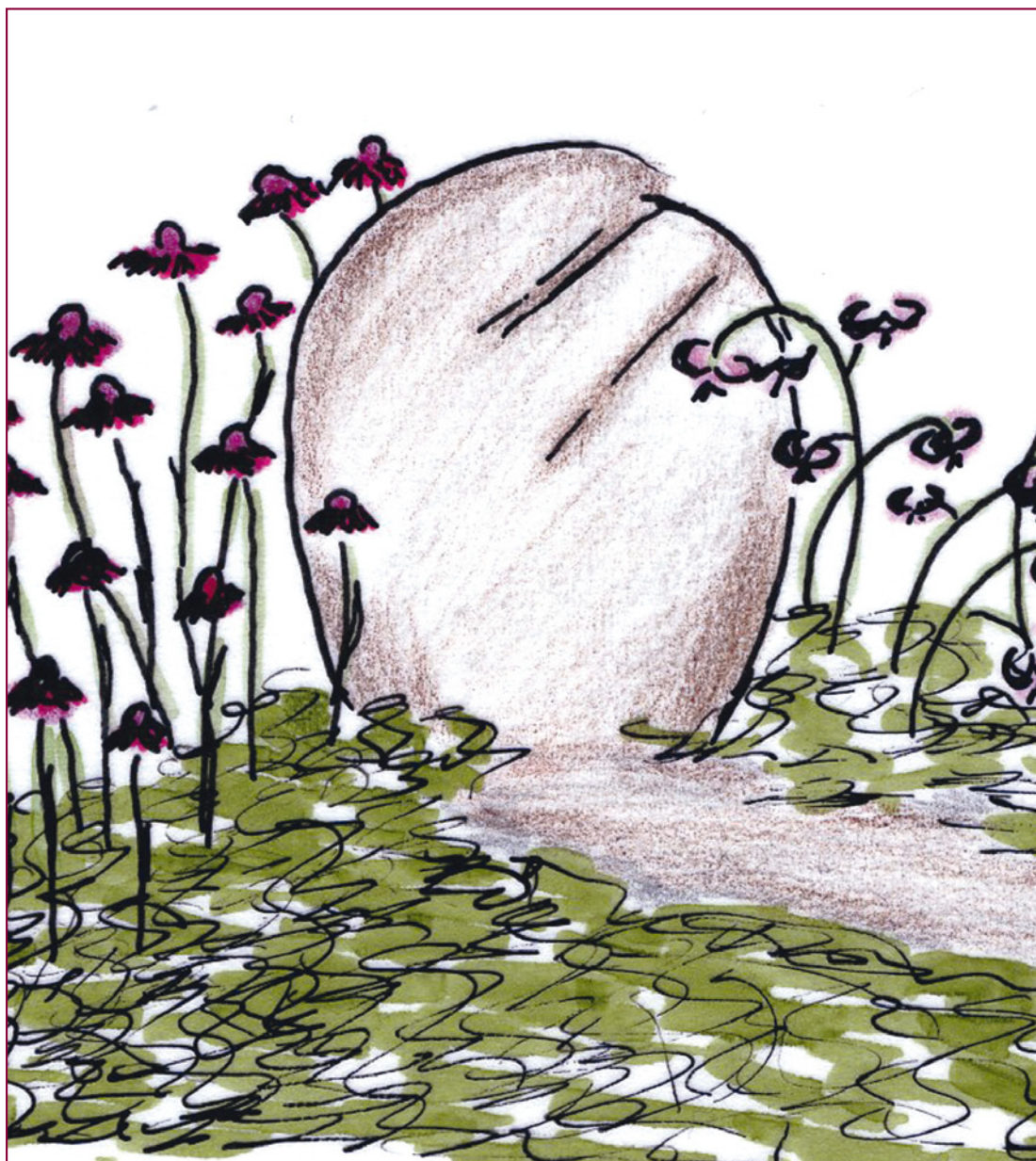
Illustration: Anna Gustafsson/Maria Orwén