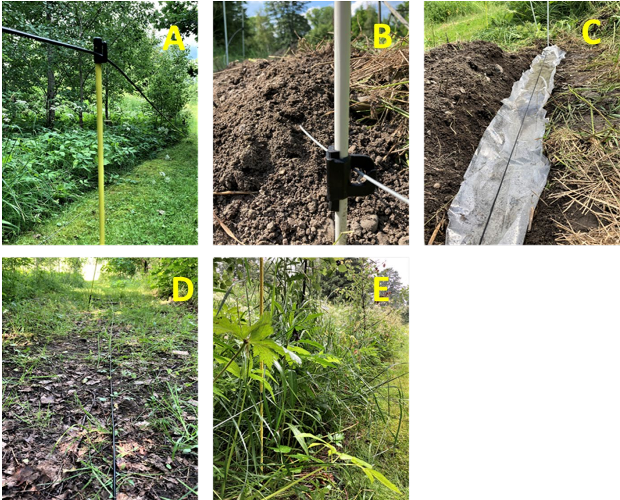
Figur 1. Illustration av de olika experimenten. A) ingen kontakt, B) kontakt med jord, C) kontakt med vatten, D) markkontakt och E) kontakt med våt vegetation. Bilderna A, C och D visar RubberGuard Wire. Bilderna B och D visar HT-järntråd.

Samtliga experiment genomfördes den 6 juli 2021: experiment 5 på morgonen i regn och övriga i soligt väder under eftermiddagen.