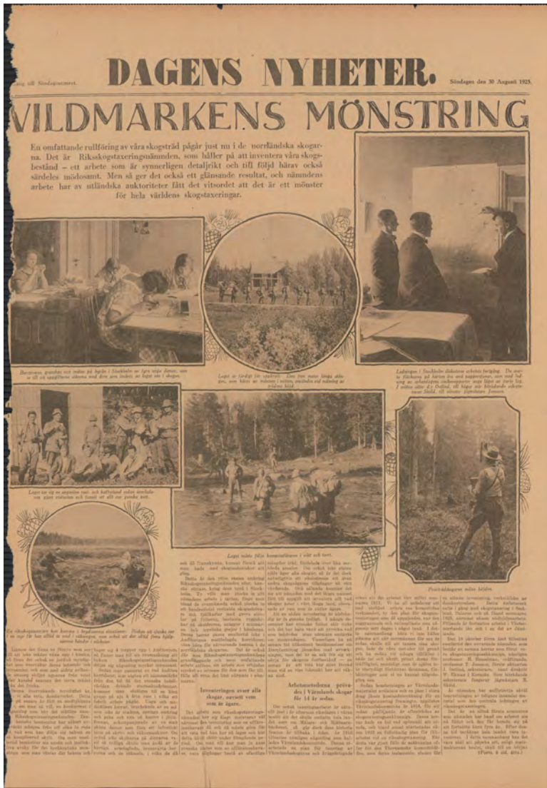
Figur 6. Den första taxeringsomgångens arbetssätt fick jämförelsevis stor uppmärksamhet.

eringen skulle leda till handlingsförklaring inför en hotande "skogsbrist": "det är alltid en fara här i Sverige, att nationen, sedan den en gång satt en stor undersökning och beviljat anslag därtill, slår sig till ro och skjuter undan alla bekymmer för den fråga som gäller, medan den ligger under undersökning" (Cassel 1924).