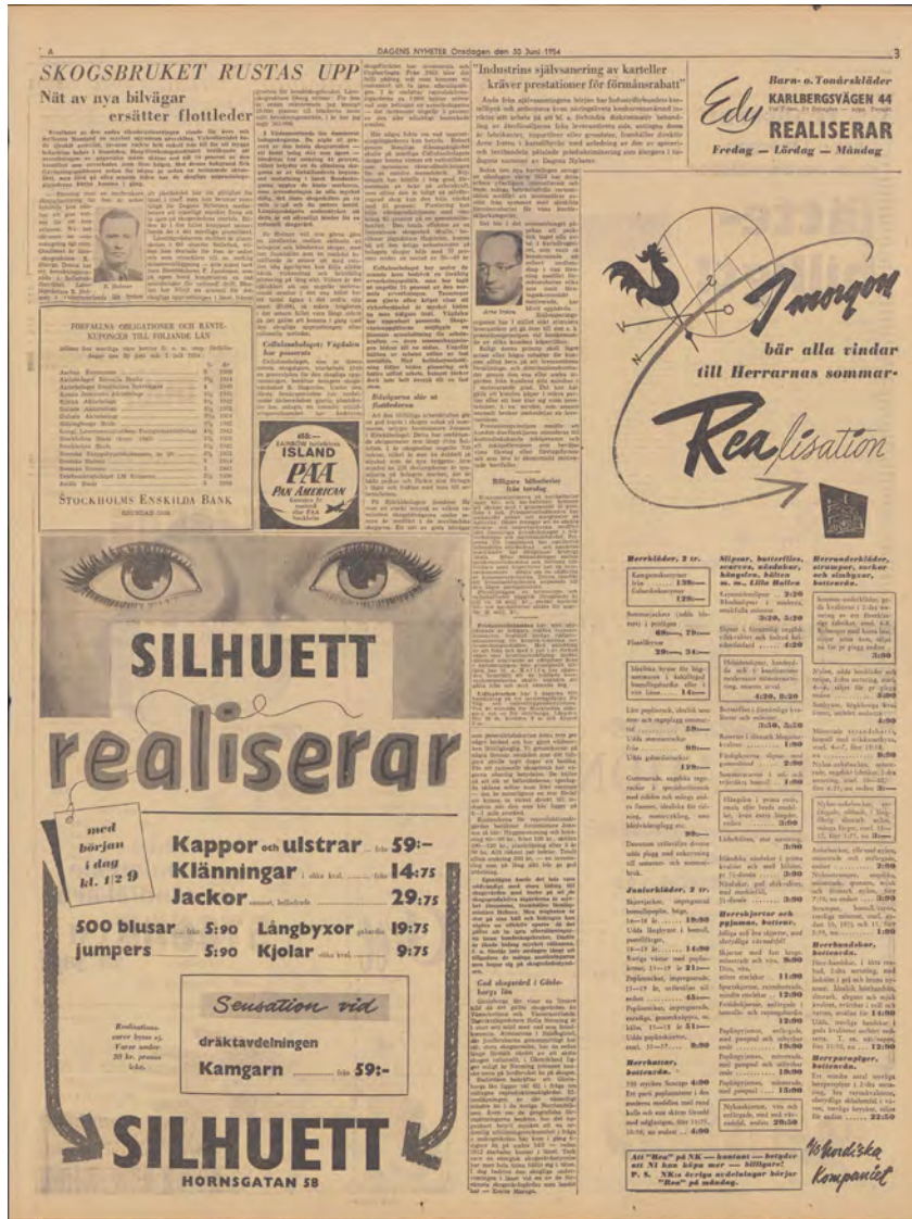
Figur 8. Dagstidningarna rapporterade återkommande om skogsbrukets mekanisering och rationalisering. Dagens Nyheter, 30 juni 1954.

i samband med att bönder ersatte mjölkproduktion med köttproduktion. Bland annat resonerade han kring bönder som ville "slippa se sina åkrar 'rationaliserade' till granskog". Han poängterade också att den första Riksskogstaxeringen, till skillnad från 1948 års skogsvårdslag, hade erkänt hagen "som en driftsform".