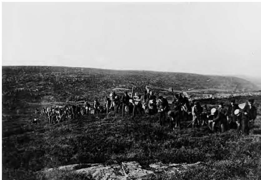
Figur 4. I det tidiga 1900-talet bidrog inte sällan barnen till skogsvården. Bilden är tagen år 1900 och föreställer skogsplantering på en ljunghed i Vålinge socken, Halland.

Under en första period, ungefär 1923 till 1945, etablerades Riksskogstaxeringen i den svenska statsapparaten. Skogsdebatten, förd av exempelvis ekonomer, skogsforskare och industrirepresen-