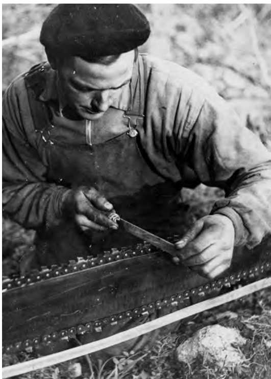
Figur 7. En viktig grund i skogsbrukets mekanisering var introduktionen av motorsågen. Bilden är tagen 1948 i Söderfors på gränsen mellan Uppland och Gästrikland.

Under åren 1945 till 1975 skapades en välfärdsstat i Sverige. Perioden kännetecknades av sociala reformer, industriell expansion, ekonomisk tillväxt – åtminstone fram till oljekrisen vid 1970-talets början – samt inte minst ett rationaliserat bruk av naturresurserna. Inom skogsbruket speglades utvecklingen i efterkrigsprojekt som ”Norrlands restaurering” (Eliasson & Törnlund 2018, Lundmark 2020, Mårald m.fl. 2017, Mårald &