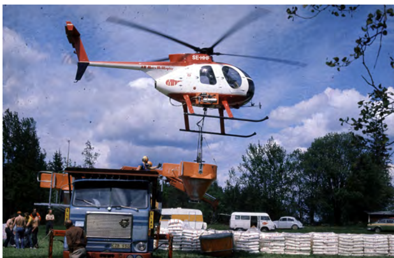
Figur 9. Skogsgödsling blev under 1970- och 1980-talet en kontroversiell teknik jämte många andra. Bilden är tagen 1977 i Kosta, Småland, och föreställer en helikopter som användes för att gödsla i skogen.

Debattartikeln fick mothugg av representanter för Skogsstyrelsen och Naturvårdsverket samt den forskare som ansvarat för Riksskogstaxeringens skadeinventering (Bengtsson 1987, Bucht & Nilsson 1987). Den senare kritiserade den allmänt