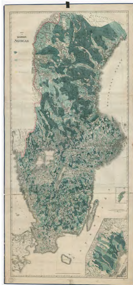
Figur 2. Kung Karl XV:s skogskarta.

Sverige som lyfte fram landets skog som en ekonomisk tillgång. Ett annat exempel är Carl von Linnés redogörelser från sina landskapsresor under 1700-talet. Efter att ha besökt olika landsändar i Sverige lät Linné ge ut skrifter med förteckningar över olika fyndigheter som kunde komma riket till gagn (Broberg 2019). Nämnas kan också Tabellverket (bildat 1749) och förstas Lantmäteriet (1632).