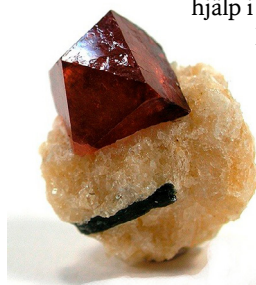
Fig. 6. Mineralen Hyacint.

Hon övertalar honom att söka hjälp i Schweiz och ger honom pengar. Efter hemkomsten håller han sig nykter men målar banalt. Hans insikt om detta gör att