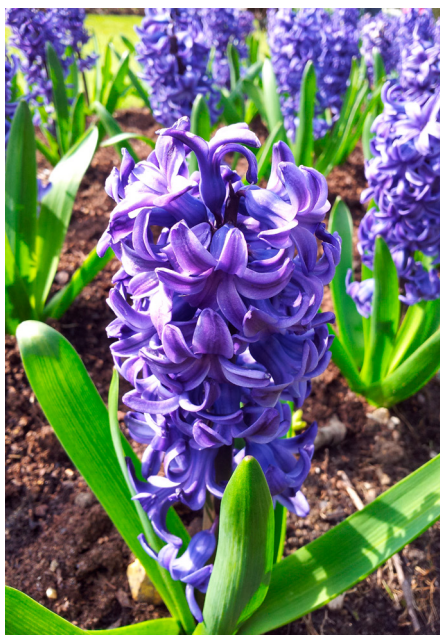
Fig. 1. Hyacint. Wikimedia.

I Storbritannien fanns hyacinter med enkla blommor på 1500-talet, århundradet därpå fyllda. På 1700-talet utbröt i England och Holland en hyacintfeber liknande tulpanfebern. Otaliga nya hyacinter korsades fram och kunde säljas för förmögenheter (14).