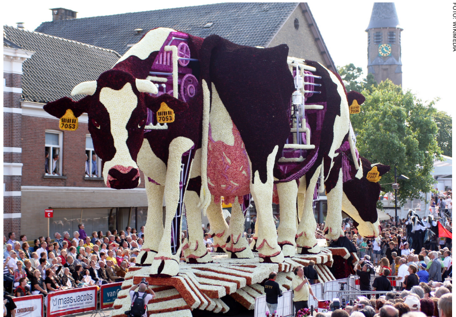
Fig. 3. Kor gjorda av hyacintblommor vid den årliga blomsterparaden i Holland.