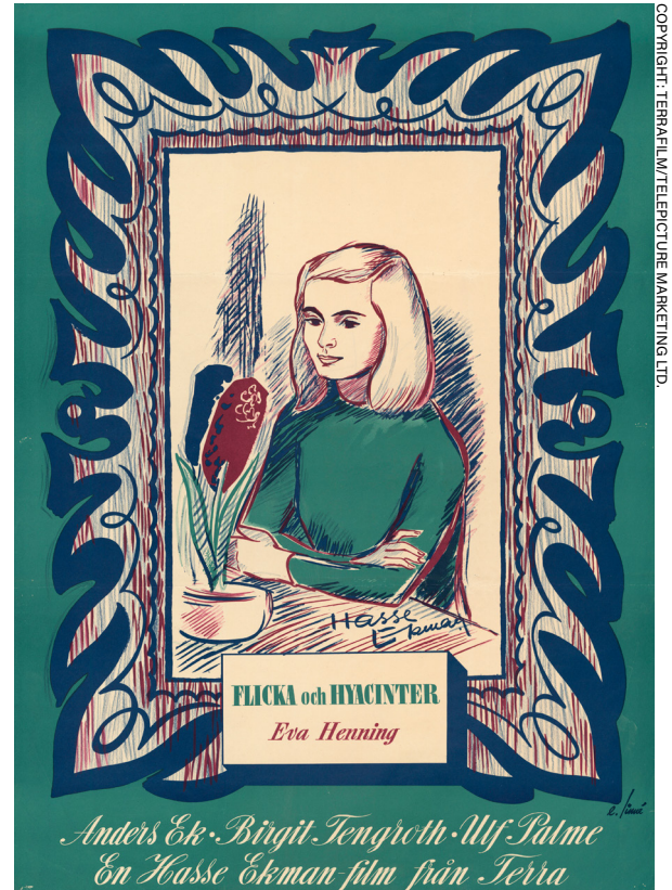
Fig. 5. Affisch till filmen Flicka med hyacinter.