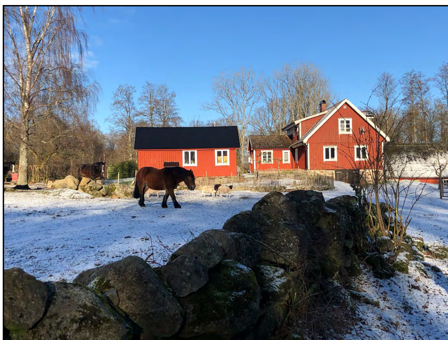
Figur 1: Närliggande vårdenheter samverkar med NUR verksamheter i detta komplement till ordinarie vård. (foto: AM Pálsdóttir).

Mellan 2002 och 2019 bedrev Sveriges Lantbruksuniversitet forskning och utvecklingsprojekt i Alnarps rehabiliteringsträdgård i samverkan med olika samhällsaktörer. Målet är att vara en del i att finna lösningar på de samhällsutmaningar som vi har stått och fortsatt står inför avseende psykisk ohälsa.