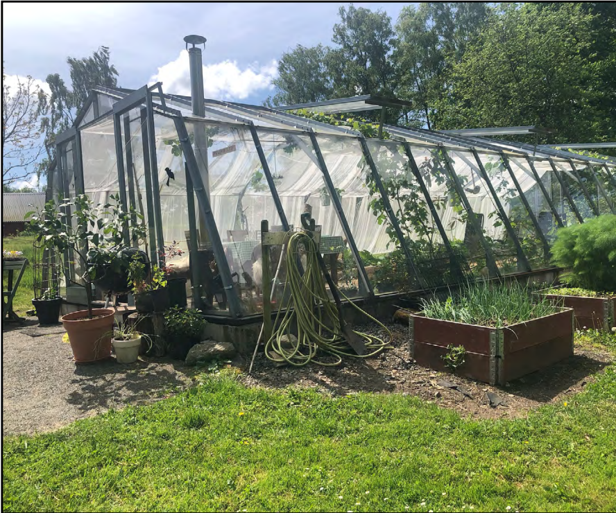
Figur 2: I upphandlingen av NUR verksamheter ställs krav på både den fysiska utemiljön men också på samlingslokalerna likväl som på vilka aktiviteter som skall erbjudas. Växthuset har en central roll i konceptet.

tet bestod av en planeringsfas med konceptutveckling med start under 2009 för att mellan 2011 – 2013 testas på 11 verksamheter i Skåne i samarbete med närliggande vårdenheter. Under projektet fick verksamheterna stöd av Lantbrukarnas riksförbund, LRF, i utvecklingen av sin affärsidé. Naturunderstödd rehabilitering på landsbygd genomfördes inom ramen för Europeiska socialfonden ESF-programmet (programområde 2) med SLU som projektägare, Region Skåne och Försäkringskassan som medfinansierare samt Arbetsförmedlingen som ytterligare samverkanspart.