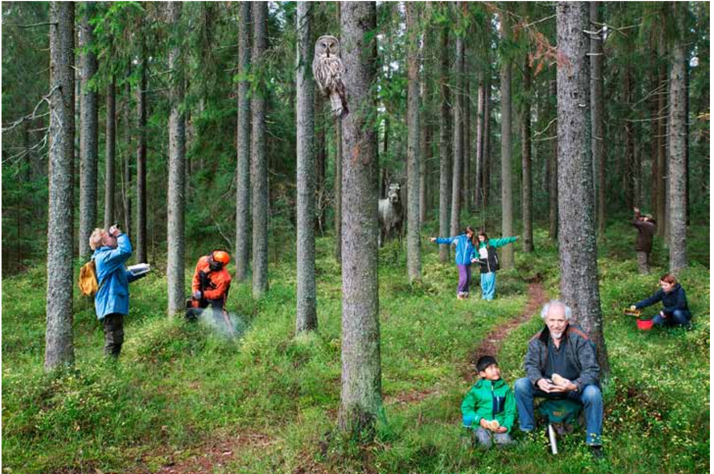
I skogen samsas många intressen. Montage Jörgen Wiklund.

F uture Forests första fas startade 2009 och pågick till 2012. Programmet växte till något unikt inom svensk skogsforskning. Unikt eftersom det strävar efter att integrera olika synsätt och forskningsdiscipliner för att lösa gemensamma problem och målkonflikter. Unikt också i sin omfattning. Under den första fasens fyra år (2009–2012) hade ett 70-tal forskare hela eller delar av sin forskning inom programmet, förutom de forskare och experter som var knutna till olika tematiska arbetsgrupper. Till sitt förfogande hade de en budget på drygt 140 miljoner kronor.