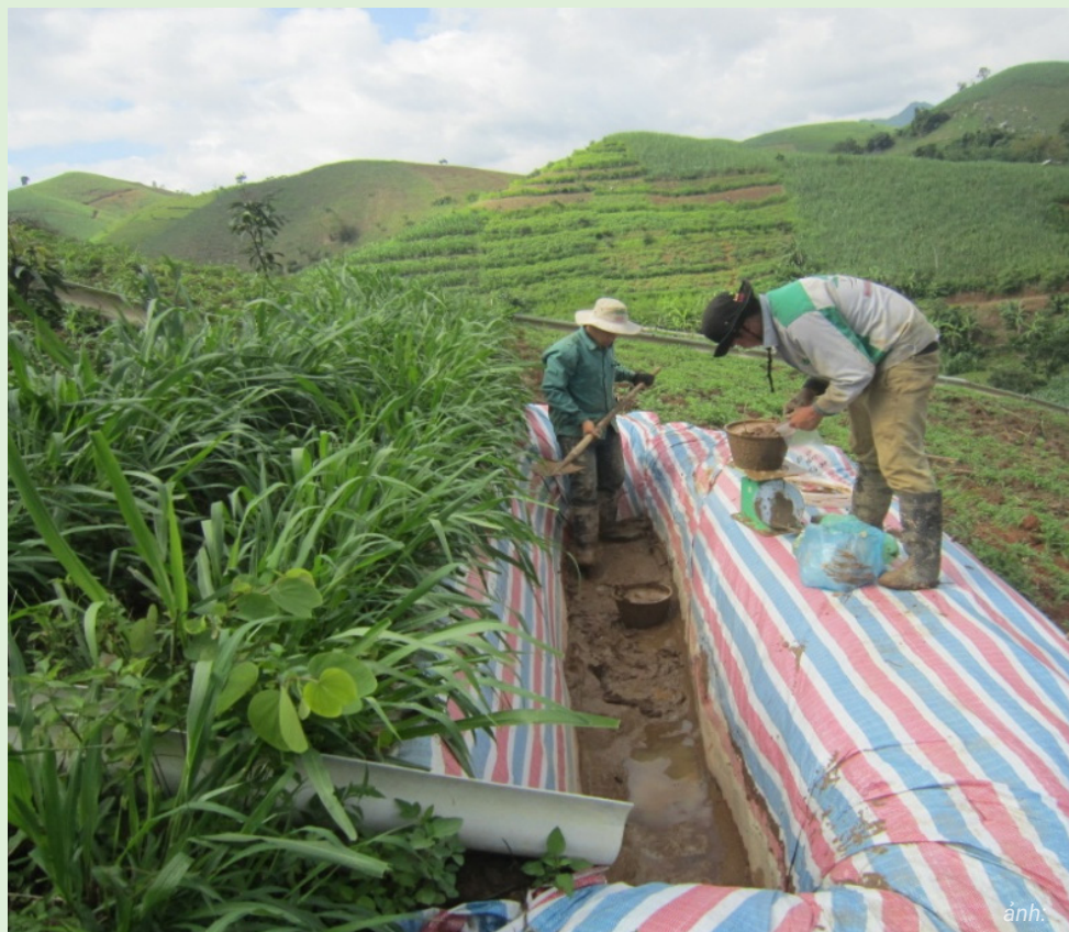
Hình 3. Thu gom đất bị rửa trôi xói mòn trong bẫy đất tại thử nghiệm nông lâm kết hợp nhãn-xoài-ngô-cỏ chăn nuôi ở Mai Sơn-Sơn La

Khi đất xói mòn trong hố bẫy đất được thu thập và cân, nó sẽ được trộn đều và sau đó lấy một mẫu phụ gồm ít nhất 300 g đất tươi và sấy khô ở 60°C cho đến khi đạt khối lượng không đổi. Phần trăm hàm lượng nước trong đất tươi sau đó được tính toán và được sử dụng để hiệu chỉnh tổng trọng lượng đất tươi đo được trên đồng ruộng về độ ẩm. Sau đó, tổng trọng lượng đất khô được tính toán bằng cách chia cho diện tích đóng góp (tính bằng ha) để tính lượng đất bị mất theo tấn trên mỗi ha (Tuấn và cộng sự, 2014; Đỗ và cộng sự, 2023).