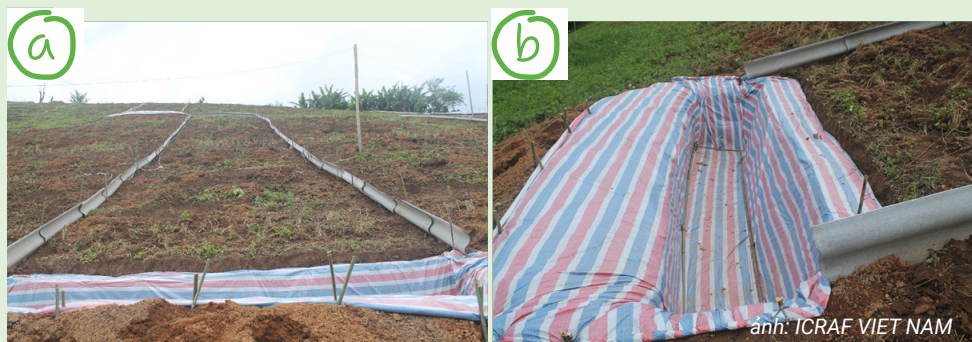
Hình 2. (a) Phên che chắn khu vực đo xói mòn đất được làm bằng tấm lợp xi măng. (b) Kích thước bẫy đất ở dưới mỗi ô xói mòn rộng 0,5 m và sâu 0,8 m. Hình ảnh từ thử nghiệm nông lâm kết hợp cỏ sơn tra-cà phê-cỏ làm thức ăn gia súc tại Tuần Giáo-Điện Biên

Các ô đo xói mòn đất được bao quanh bởi các tấm lợp xi măng, tấm kim loại, gỗ hoặc bất kỳ vật liệu nào có thể ngăn chặn rò rỉ và dòng chảy tràn vào và ra khỏi ô (Morgan, 2005). Tấm lợp xi măng được khuyến dùng vì nó có chi phí thấp và bền (Hình 2a).