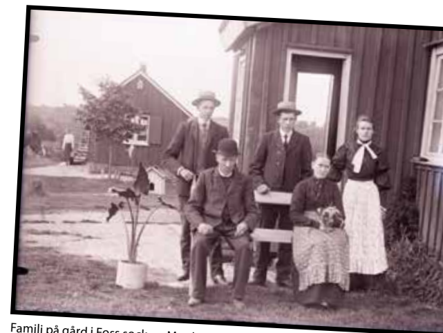
Familj på gård i Foss socken, Munkedal omkring år 1910.

Breven som har kommit in är väl spridda över landet, alla landskap är representerade. Flest tips har kommit från Skåne, Västergötland, Uppland, Södermanland och Lappland. I många av breven medföljer underbara berättelser om krukväxter. Många har fått en krukväxt när de har lämnat barndomshemmet eller i samband med dop eller bröllop. Det bästa sättet att bevara en släktklenod var genom att sprida den. Inom Krukväxtuppropet pågår det inte någon större provodling som för de övriga uppropen. Istället har vi gjort mindre provodlingar av pelargonier, november och julkaktusar, begonior och hibiskusar. I den nationella genbanken kommer ett 175 tal olika krukväxter att bevaras. Vilka dessa blir bestäms av referensgruppen för uppropet.