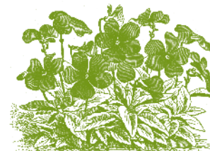
No. 1854 Viola cornuta Perfektion. 1. Höhe 20 Flg.

I bevarandet innefattas även sorter av som tagits fram av 1900-talets svenska växtförädling.