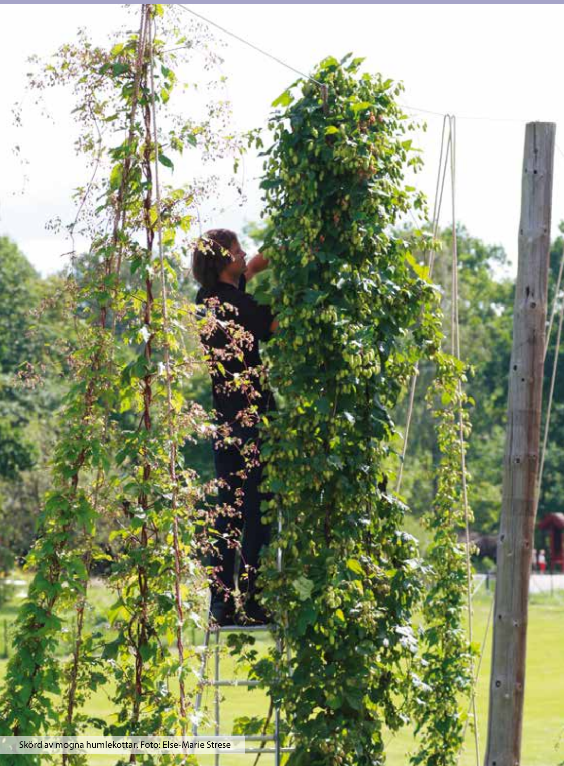
Skörd av mogna humlekottar.