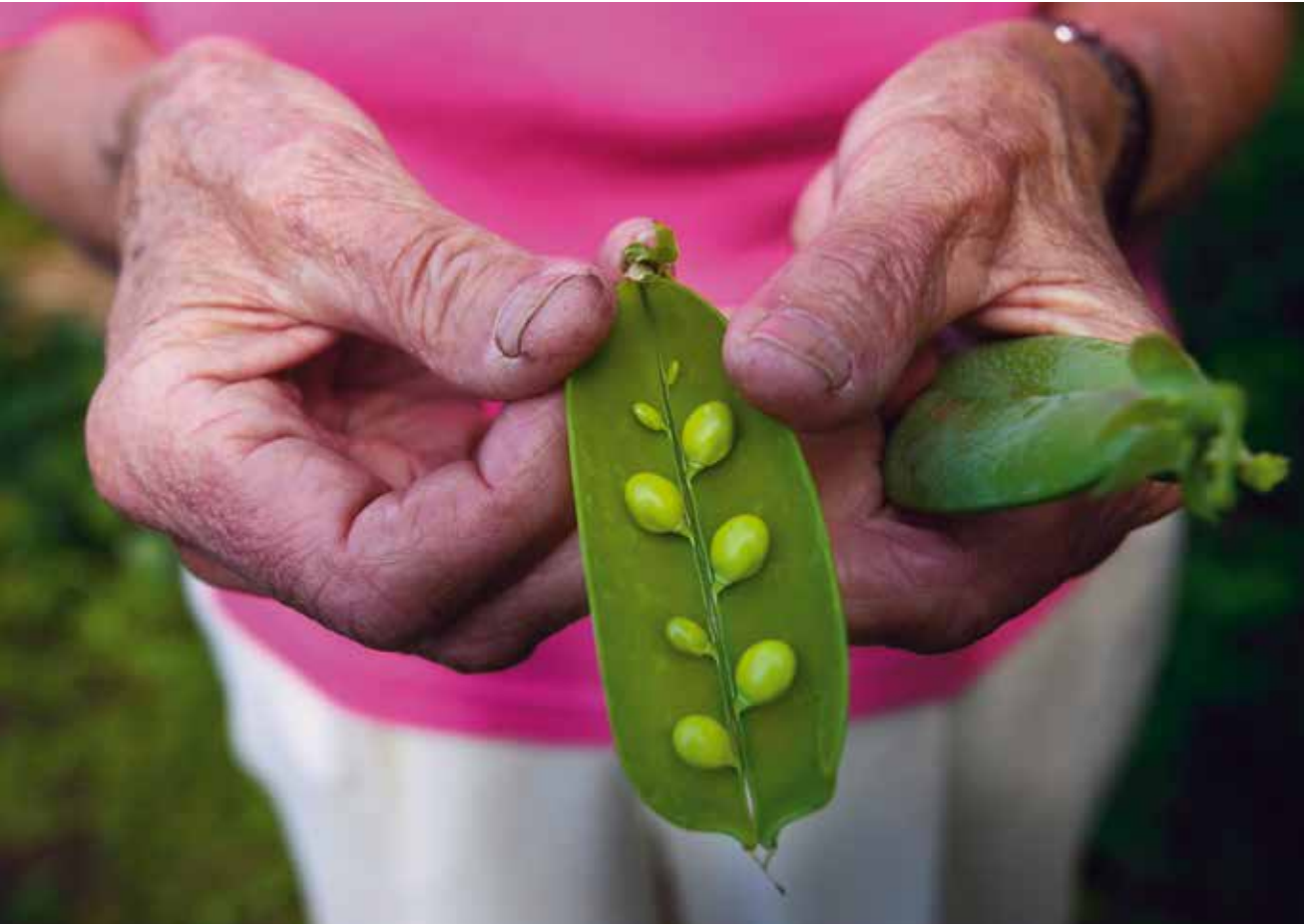
Stensårt från Norrhult.