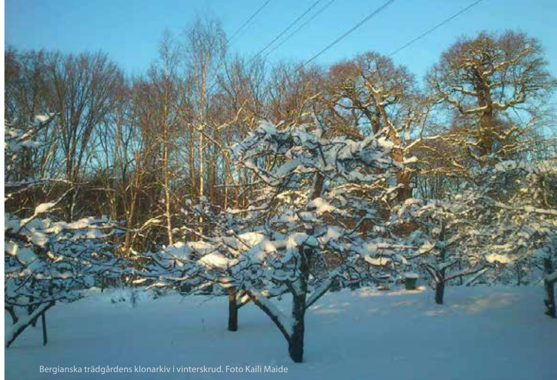
Bergianska trädgårdens klonarkiv i vinterskrud.

Idag finns 14 lokala klonarkiv som på uppdrag av POM bevarar drygt 300 mandatsorter av frukt. Sorternas fördelning mellan klonarkiven reflekterar deras ursprung. Sålunda bevaras 'Kalmar glasäpple' i Småland och 'Värmlands paradisäpple' i Värmland. På sikt kommer även prydnads- och köksväxter att bevaras lokalt, i såväl befintliga som nytillkomna arkiv. Som odlingsvärdar för de lokala arkiven fungerar trädgårdsskolor, museer, botaniska trädgårdar och offentliga anläggningar. Klonarkiven fyller en viktig funktion genom att levandegöra vårt gröna kulturarv.