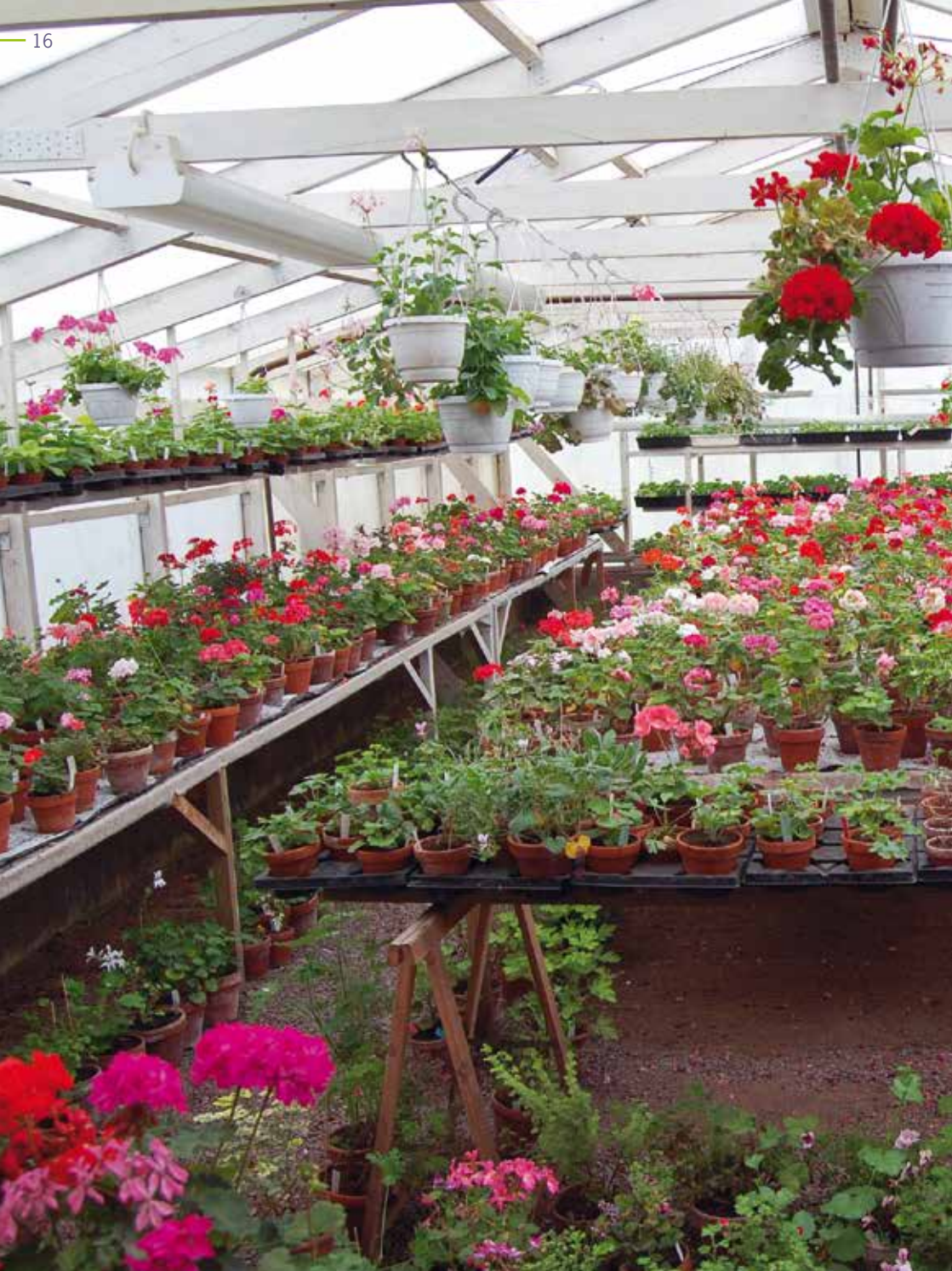
Medlemmar från Pelargonsällskapet har hjälpt oss att provodla äldre pelargonier.