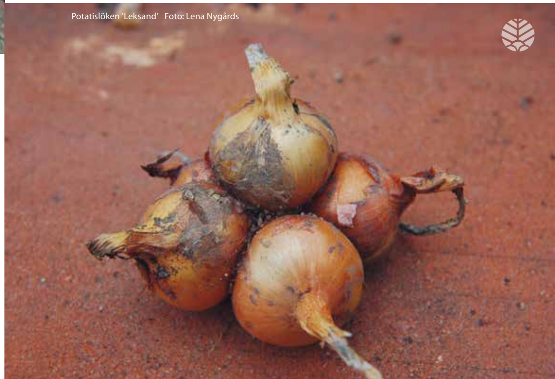
Potatislöken 'Leksand'