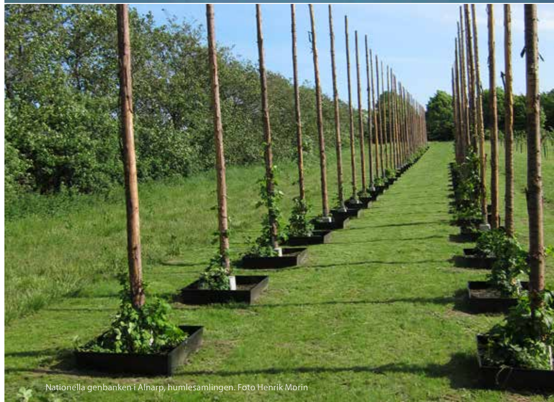
Nationella genbanken i Alnarp, humlesamlingen.