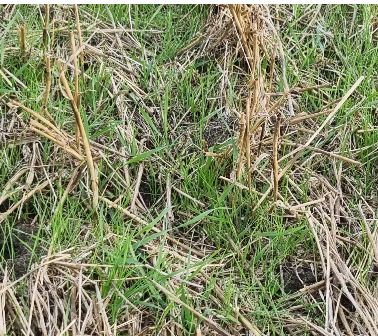
Renkavle ( Alopecurus myosuroides Huds.) är ett ettårigt vinterannuellt gräsogräs som framför allt orsakar stora problem i höstspannmålsdominerade växtföljder på lerjordar.

Falsk såbädd med ytlig harvning stimulerar groningen hos renkavle. Uppkomst sker efter 7 till 10 dagar